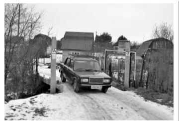
нерка не без приятства увидела: а сон-то в руку!