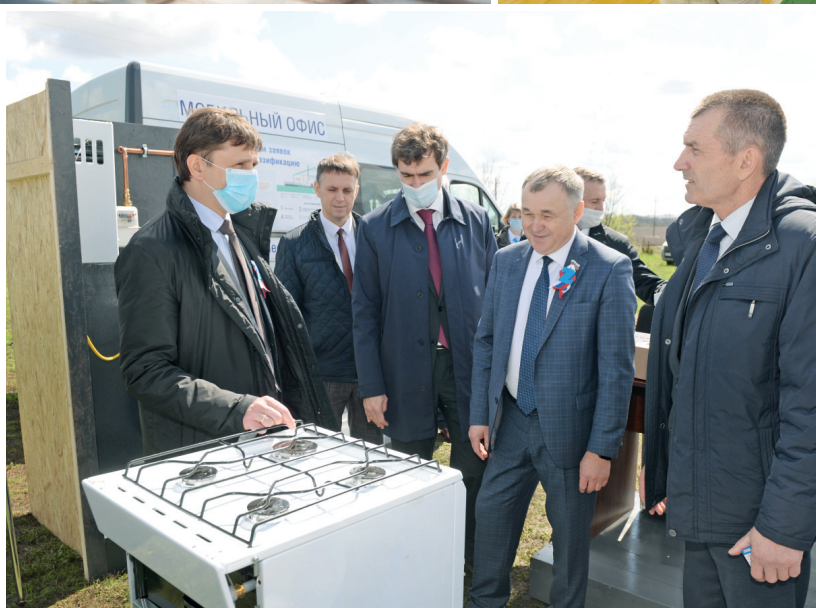
Широкий выбор бытового газового оборудования