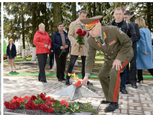
Мужеству забвенья не бывает!