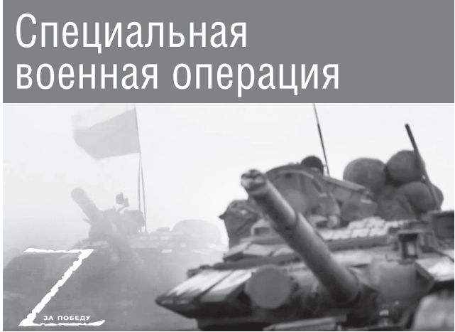
ГЕРОИ НАШЕГО ВРЕМЕНИ