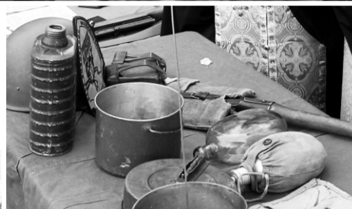
Самые ценные находки — личные вещи бойцов