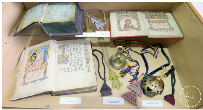
Церковные вещи: книги, лестовки, кацея