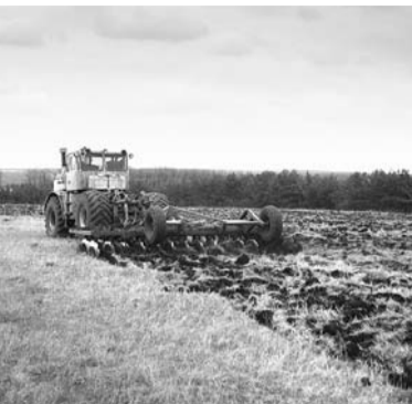
весь цикл защиты растений от сорняков, вредителей и болезней. То есть на здешних полях ныне наука и практика в ногу идут.

Кстати, на отдельных полях в 2006-м урожайность превышала 700 центнеров с гектара.