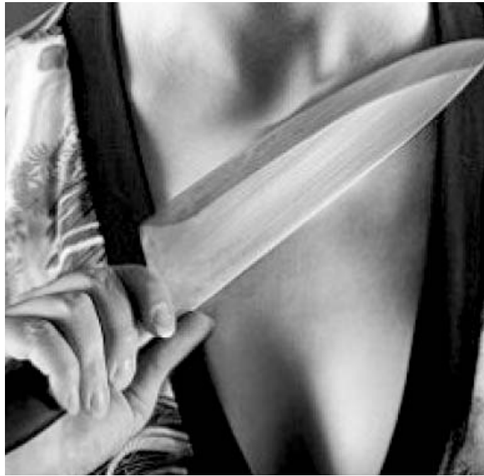
Чудом женщина осталась жива.