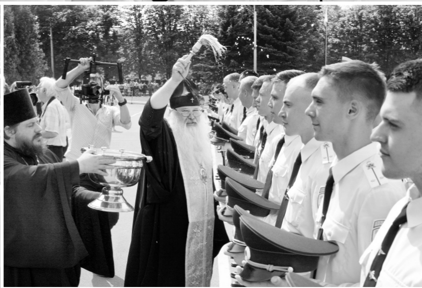
Митрополит Антоний — Благодать Божия да пребудет с вами!