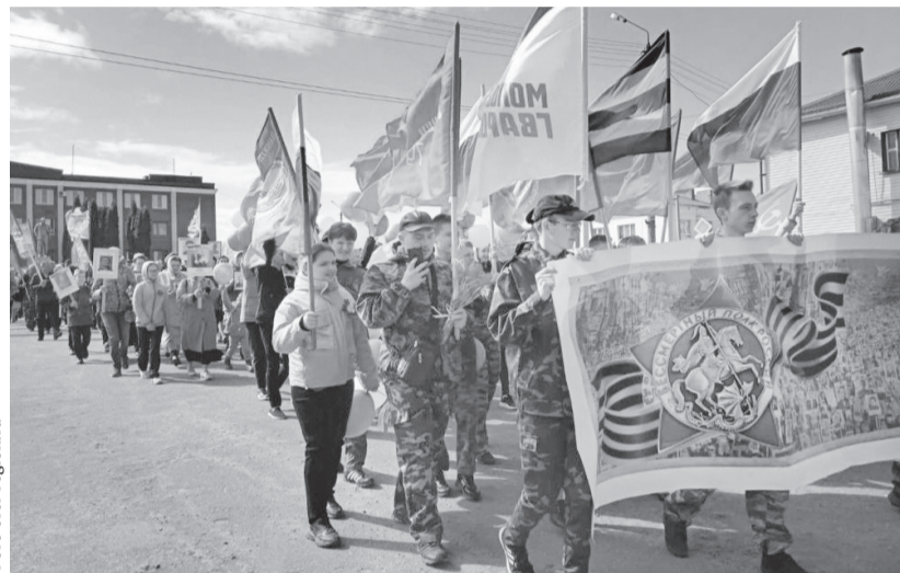
Бессмертный полк в Покровском районе

Как известно, оккупанты вторглись на нашу территорию 21 ноября 1941 года в ходе наступления на Москву. Но уже в декабре в ходе Елецко-Ливенской наступательной операции часть района советские войска сумели освободить. Полоса фронта остановилась на