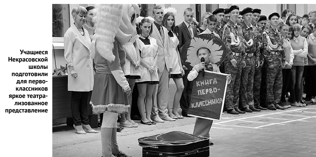
Учащиеся Некрасовской школы подготовили для первоклассников яркое театральное представление

— Уважаемые учителя, приветствую вас с теплом в сердце, потому что именно вы помогли мне пройти большой путь от парты первоклассника до тренажёра МКС Центра подготовки космонавтов. Спасибо вам огромное! Дорогие ребята, вам очень повезло учиться в замечательной школе с отличными учителями. Желаю вам больше работать над собой! Без достойного образования успеха в жизни не будет. Каждому становится космонавтом совсем не обязательно, а постараться хорошо учиться должны все — и тогда всё у вас обязательно получится. Желаю всем космической удачи!