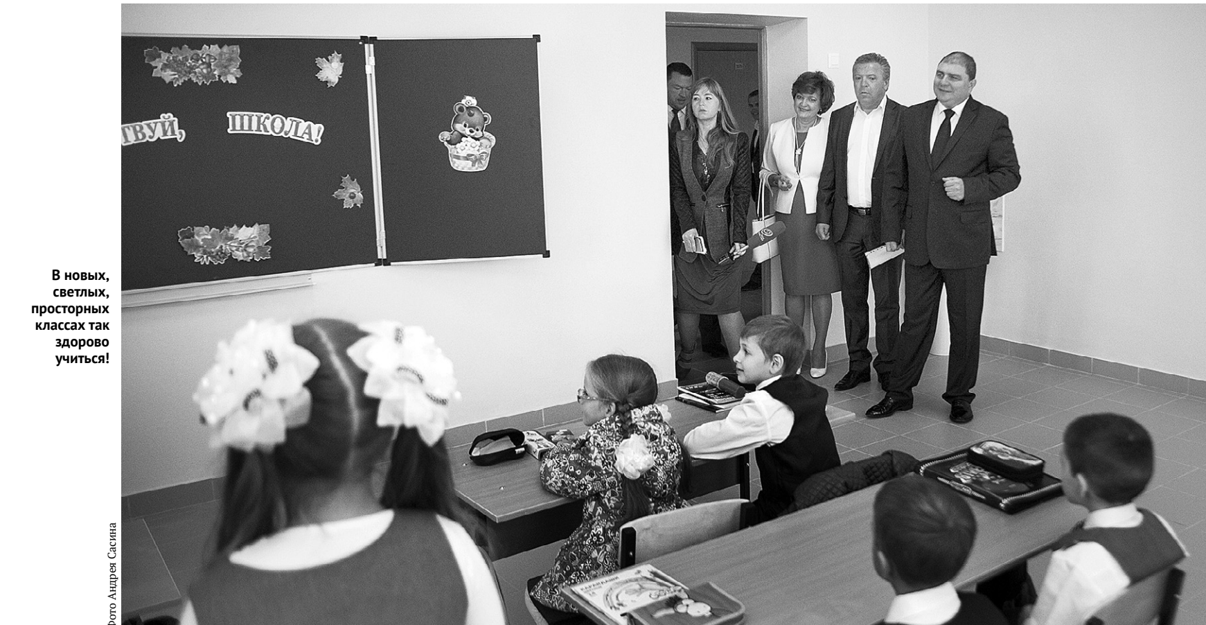
В новых, светлых, просторных классах так здорово учиться!