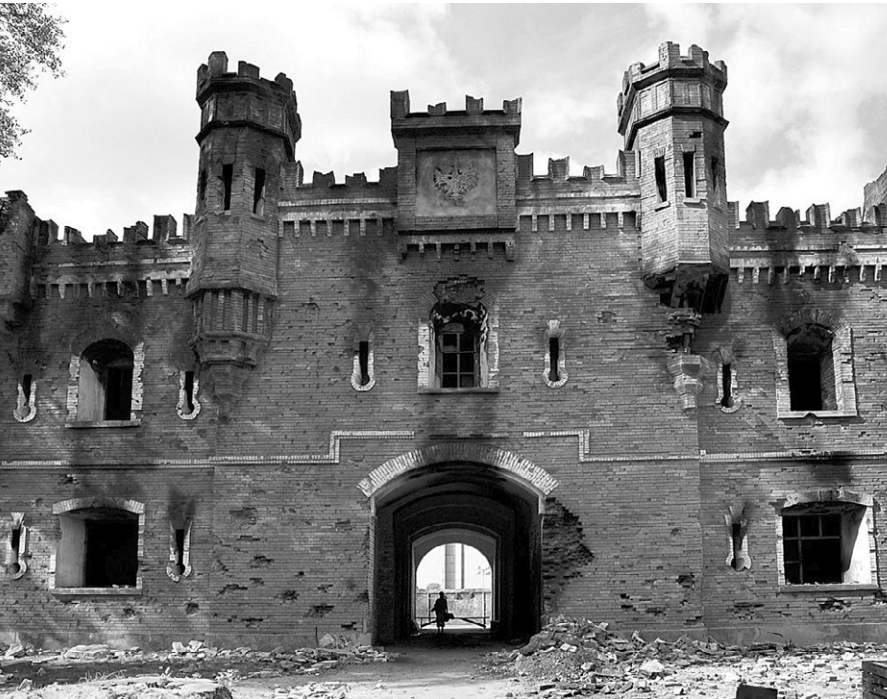
Холмские ворота цитадели