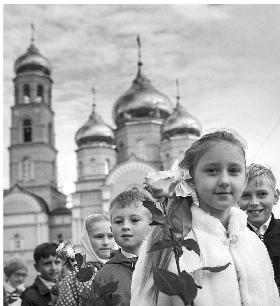
Цветы учителю в День знаний