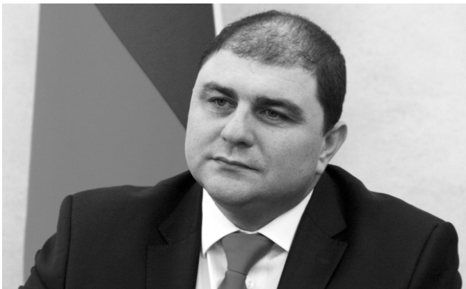
Обращение к старшеклассникам губернатора Орловской области Вадима Потомского:

Эти уроки, главная цель которых помочь старшеклассникам определиться с выбором будущей профессии, прошли во всех российских школах. Онлайн-уроки состоялись в рамках Всероссийского форума профессиональной навигации «ПроеКТОрия», который в соответствии с поручением Президента РФ Владимира Путина прошёл в г. Ярославле.