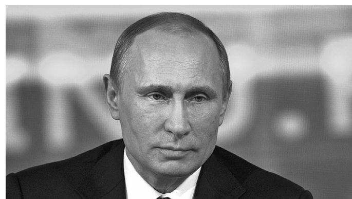
Обращение Президента Российской Федерации Владимира Путина к старшеклассникам:

Дорогие друзья! Открытый урок «Россия, устремлённая в будущее» приурочен к началу учебного года. Поэтому хочу всех преподавателей, студентов и школьников поздравить с этим замечательным праздником.