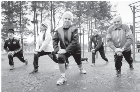
За пять месяцев 2025 г. в регионе на реализацию нацпроекта «Продолжительная и активная жизнь» направлено 228 млн. рублей

— При поддержке Правительства РФ наш регион продолжает решать комплекс вопросов социально-экономического развития. За пять месяцев, по предварительным итогам, объём безвозмездных поступлений из федерального бюджета составит 6,7 мил-