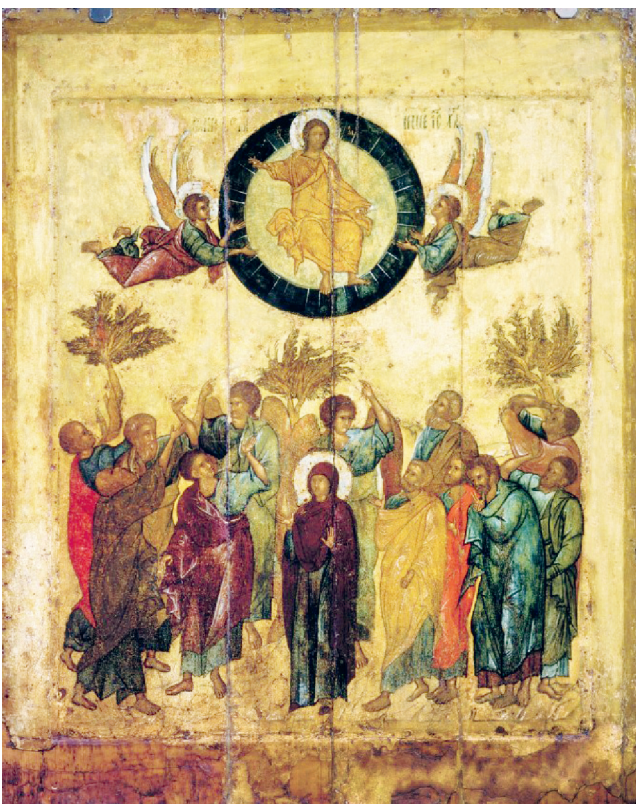
Икона «Вознесение Господне»

Можно представить себе потрясение апостолов, когда они видели возносящегося Господа. Они встали перед проблемой отрицания всего опыта избранного народа, накопленного им за тысячелетия. Ученики Христа оказались перед книгой, в которой все листы чистые и которую надо писать заново.