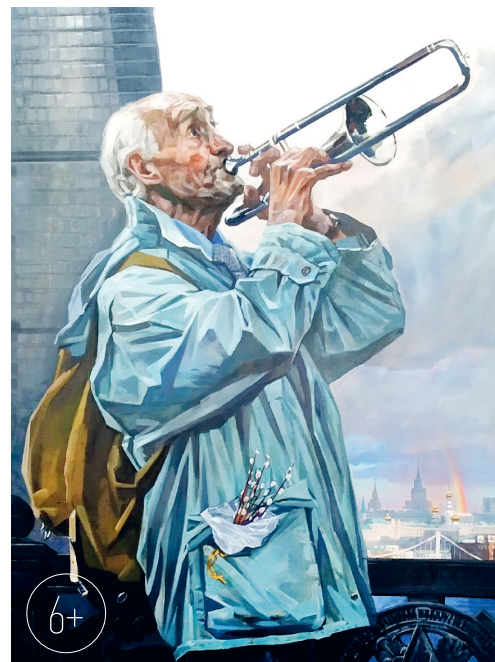
«Бог есть Любовь. Музыкант»