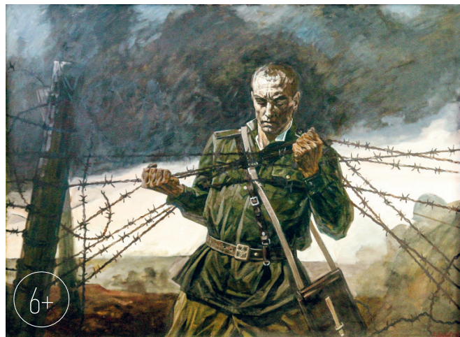
«Подвиг лейтенанта Кондратьева»