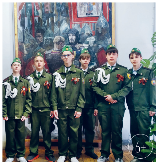
Орловские лицеисты на выставке картин Андрея Дроздова