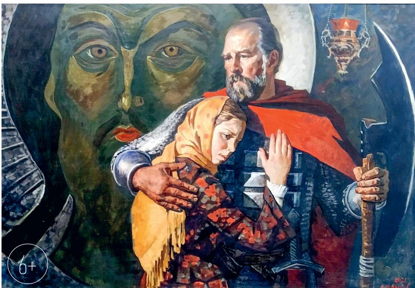
«На страже Отечества»