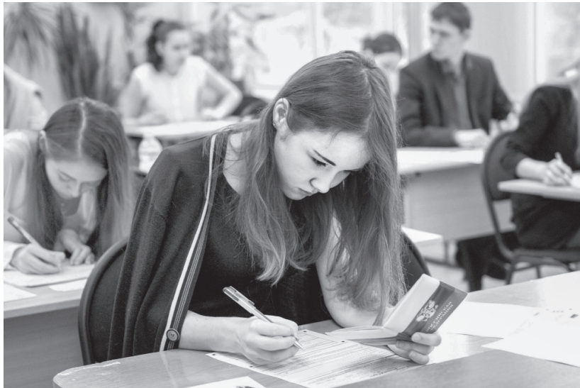
В Орловской области созданы все условия для проведения ГИА

В Орловской области созданы все условия для проведения ГИА. В целях подготовки учащихся в регионе реализуется проект