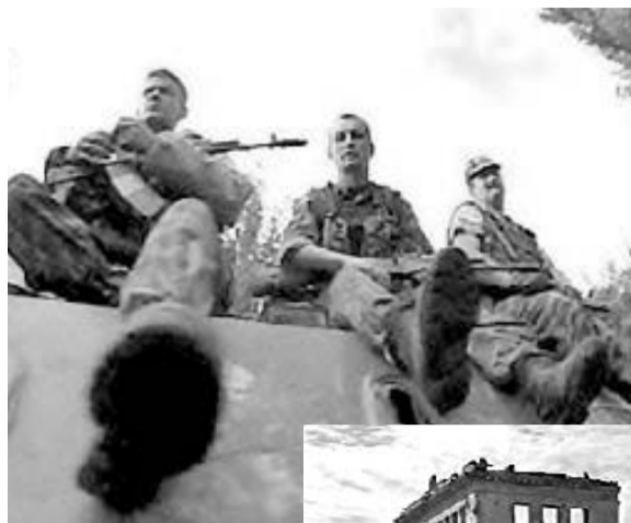
Боеестолкновения шли по всему городу, когда, по данным радиоперехвата, в поддержку сепаратистам в Грозный вошёл заграночный батальон «Белые колготки». Никто из бойцов не подозревал, что за шутовым названием таится смертельная угроза для каждого из них.