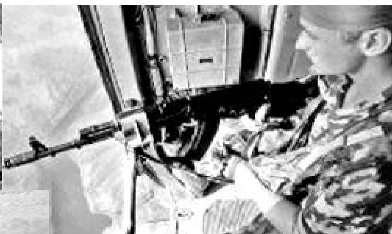
«Вольво». Тот в ответ пообщался сдвигавшимся добровольно-наемным батальоном «Белые колготки», и сепаратисты решили осуществить расчет по-своему — с каждой распытывавшей пулей.