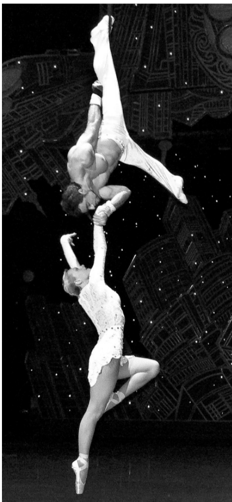
Фрагмент номера «Воздушное адажио»