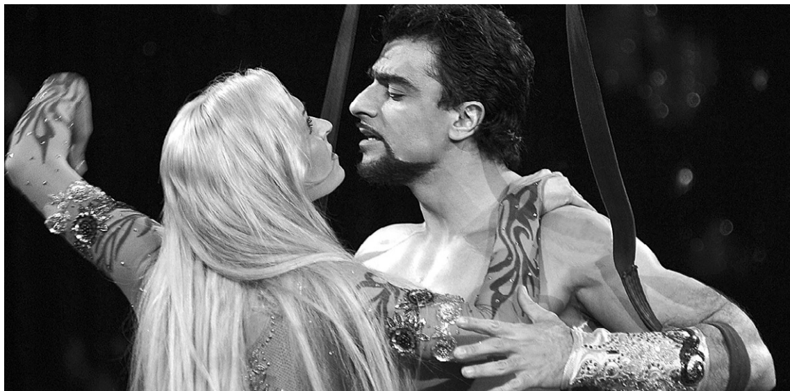
«Воздушное адажио» покорило зрителей лучших цирков мира