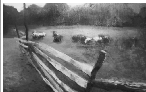
Художник работает во многих жанрах