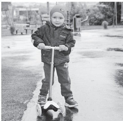
Центральный парк с. Тросна — любимое место отдыха и детей, и взрослых

рынков сельскохозяйственной продукции, сырья и продовольствия в Орловской области».