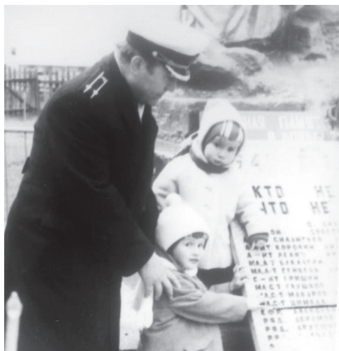
К братской могиле приходят и взрослые, и дети