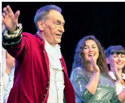
Слова признательности за верность орловской сцене и апло- дисменты юбилею

и многолетнее служение, за огромную палитру ролей, образов, спектаклей, которые вы подарили всем нам.