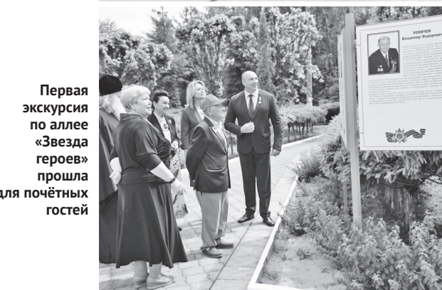
Первая экскурсия по аллее «Звезда героев» прошла для почётных гостей

жили живые цветы и гирлянду Славы к монументу героям-танкистам и памятнику дважды Герою Советского Союза