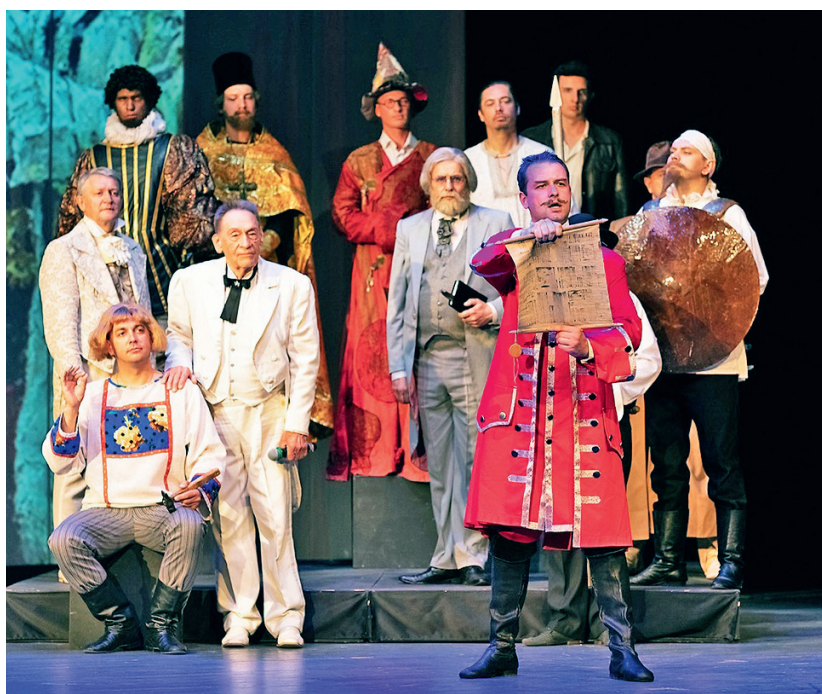
Роли, образы, спектакли и года...