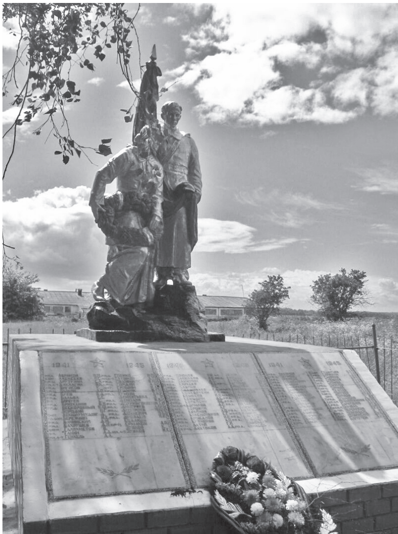
Обелиск в селе Среднем

Доподлинно неизвестно, был ли он ранен и затем попал в госпиталь, либо заболел, простудившись в сырых, промозглых окопах. В документах, обнаруженных в архиве, причиной