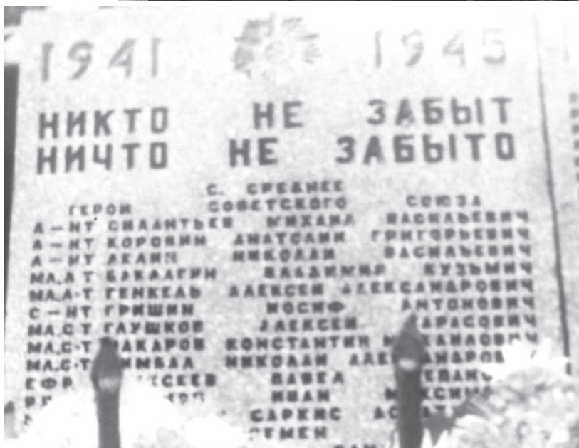
На гранитной плите увековечено и имя Генкеля