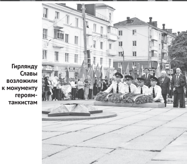
Гирлянда Славы возложили к монументу героям-танкистам

В четыре утра по всей стране зажгли свечи — символ Вечного огня и памяти о жертвах фашизма