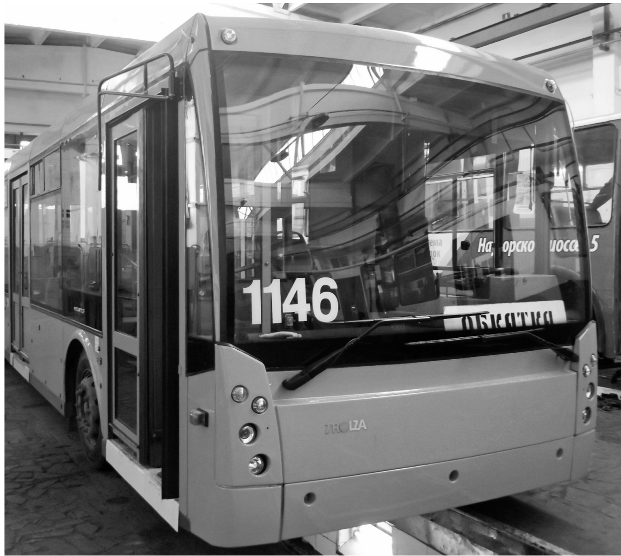
Троллейбус хоть сейчас готов отправиться в путь