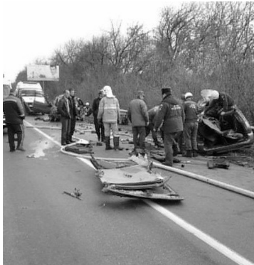
Погибшие были жителями Орловской области

Трагедия произошла в начале одиннадцатого утра. На 386-м километре автодороги Москва — Харьков на встречную полосу выскочил «опель». Иномарка на огромной скорости столкнулась с легковушкой. В результате удара четверо человек — муж, жена, их годовалая дочка и ее 70-летняя прабабушка, сидевшие в автомобиле ВАЗ-2111 — скончались на месте. Двое человек, сидевшие в «опеле», старшему из которых было 25 лет, в тяжелейшем состоянии доставлены в больницу.