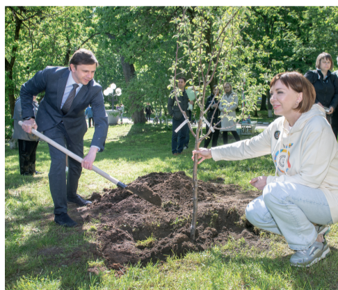
Добрый сад В городском парке культуры и отдыха Орла посадили яблоневый сад