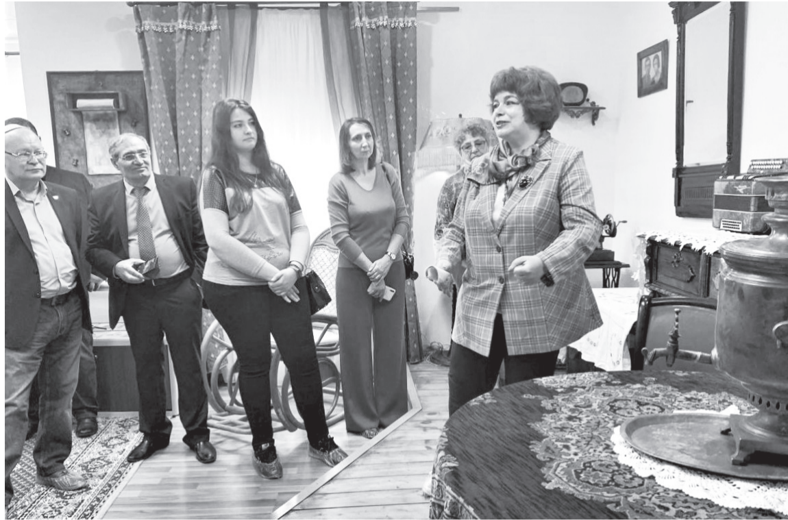
Музей еврейской истории и быта хранит не только интересные экспонаты, но и бесценные воспоминания

В музее также представлены экспонаты, повествующие о знаменитых туляках,