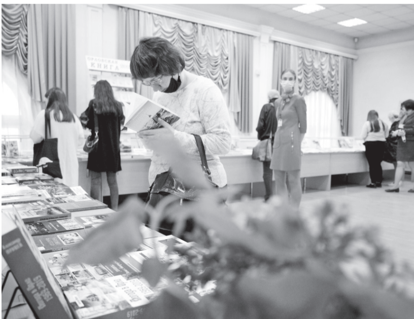
Праздник книги — это праздник для каждого ценителя слова

В читальном зале развернулась широкая экспозиция книжно-документальных выставок из фондов областной библиотеки: «Книги — лауреаты губер-