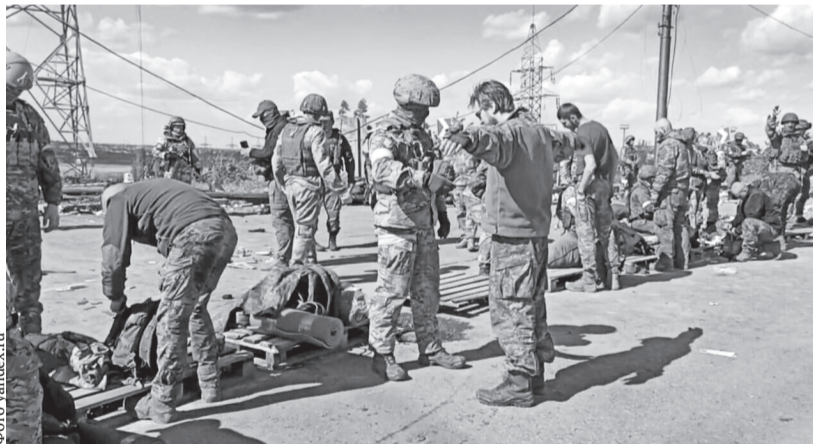
«Героические» боевики покорно дают себя обыскивать

опрятные, довольно крепкие молодые люди в форме, с оружием. Нельзя сказать, что они похожи на пленных румын времён Сталинградской битвы. Значит, вывод: ресурса к сопротивлению они не исчерпали — они исчерпали морально-волевой ресурс.