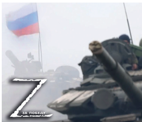
Специальная военная операция