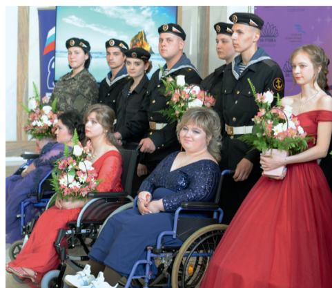
«Золушки единой страны» 20 мая в фундаментальной библиотеке ОГУ им. И. С. Тургенева прошёл конкурс красоты среди девушек с ограниченными возможностями здоровья