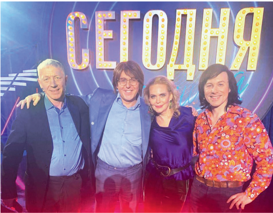
Попасть на музыкальную передачу к Андрею Малахову мечтают тысячи талантливых людей