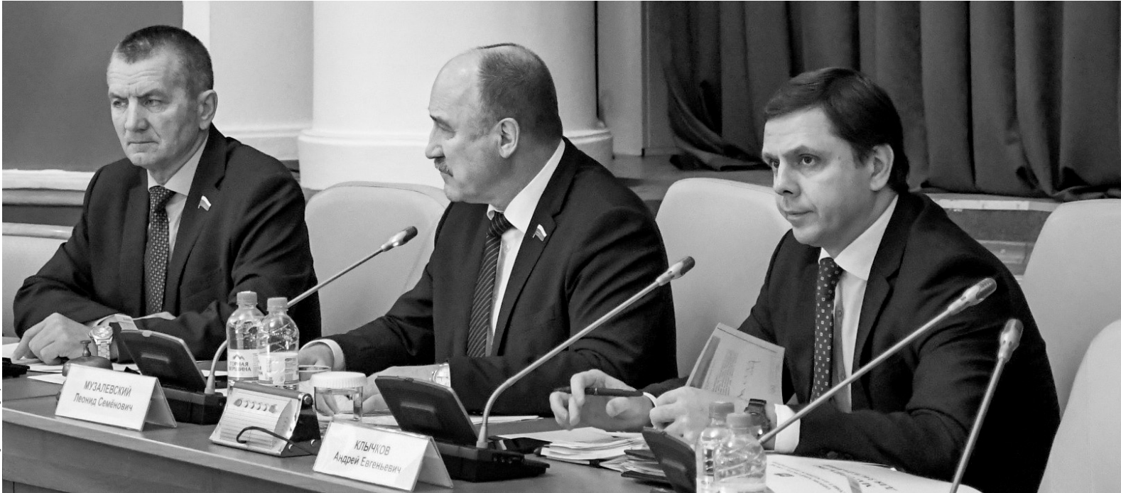
На 40-м заседании регионального парламента депутаты рассмотрели 21 вопрос

По его словам, в целом удалось обеспечить контроль за опе-