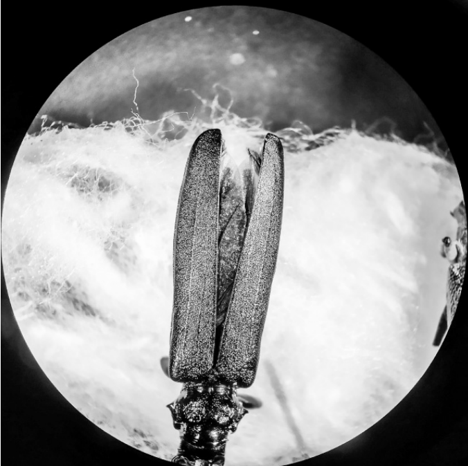
Мускусный усач под микроскопом