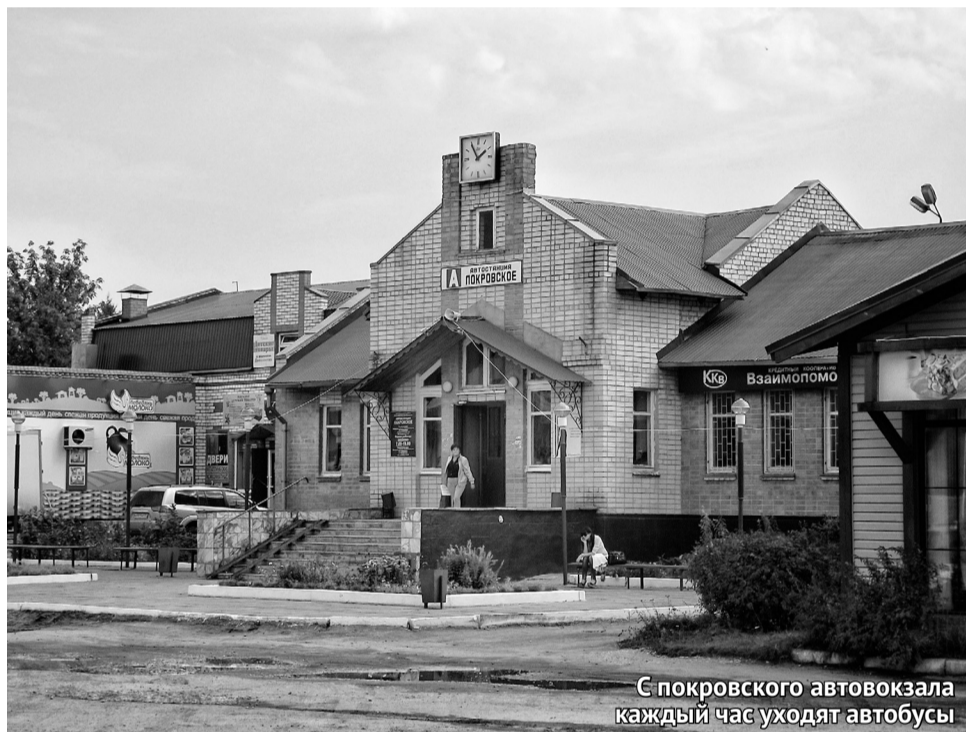
С покровского автовокзала каждый час уходят автобусы

ка то и дело разъезжаются в разные стороны автобусы. Село находится в отдалении от железной дороги, поэтому автомобильная дорога является главной транспортной артерией района.