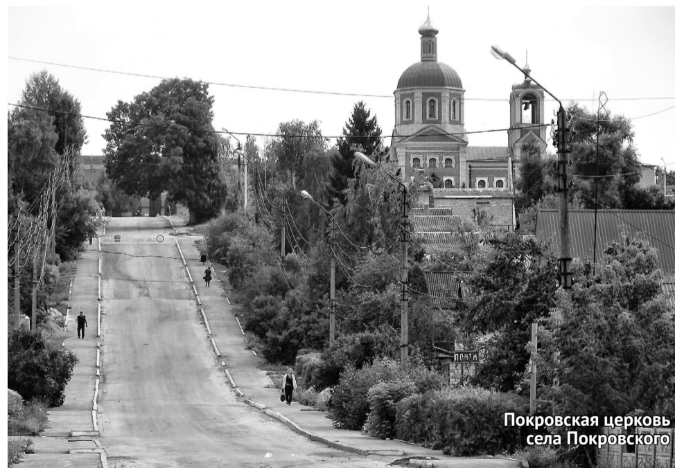
Покровская церковь села Покровского

Работы Орловского — скульптуры Кутузова и Барклай-де-Толли у Казанского собора в Санкт-Петербурге. Ну и, пожалуй, самый знаменитый памятник Северной столицы — Александровскую колонну — посреди Дворцовой площади украшает крестонный Ангел, выполненный