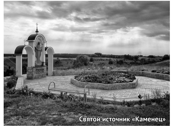
Святой источник «Каменец»

ликлиники. Селяне не радуются на неё, настолько она хороша. В поликлинике наряду с обычными кушетками стоят кожаные диванчики. Стены детского отделения красочно расписаны. Покровская поликлиника по своему комфорту больше напоминает частное медзаведение. Однако, несмотря на райские условия работы и новое оборудование, больница, как в воздухе, нуждается в новых кадрах. А их все нет.