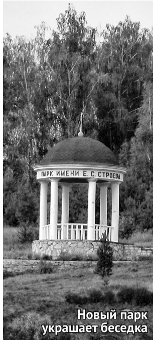
Новый парк украшает беседка