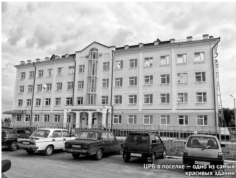
ЦРБ в поселке — одно из самых красивых зданий

В Покровском построена большая новая больница. Строили здание четыре года. В 2012 году состоялось долгожданное открытие больницы и по-