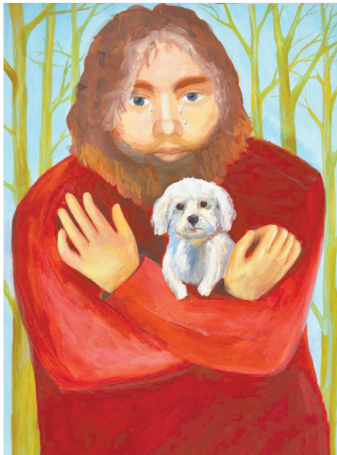
«Герасим» — одна из работ, посвящённых 200-летию со дня рождения И. С. Тургенева