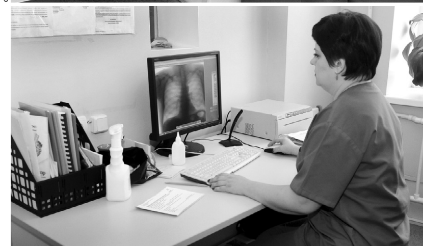
Орловский противотуберкулёзный диспансер обладает самым современным оборудованием