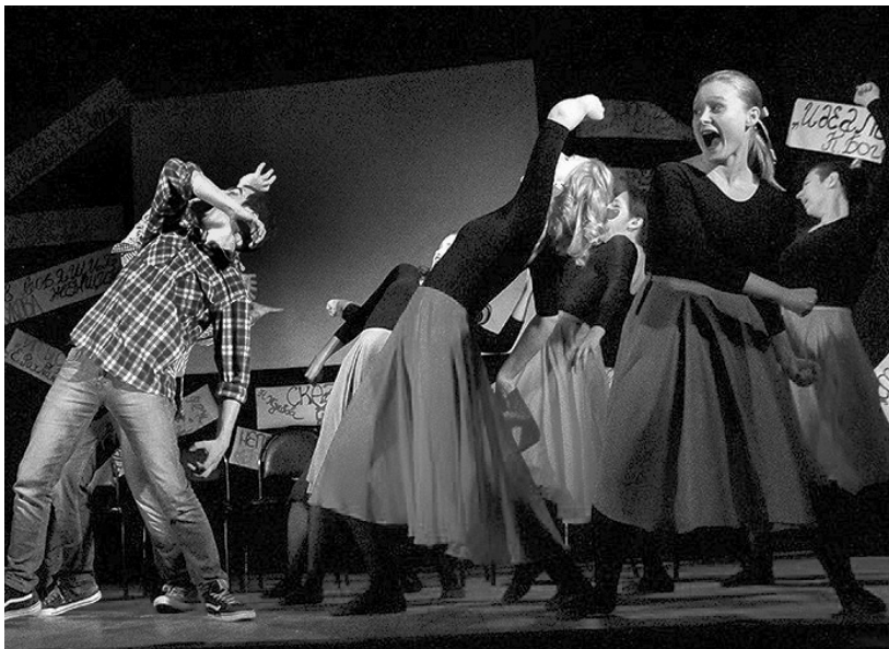
Спектакль — как обновление, динамика, экспрессия