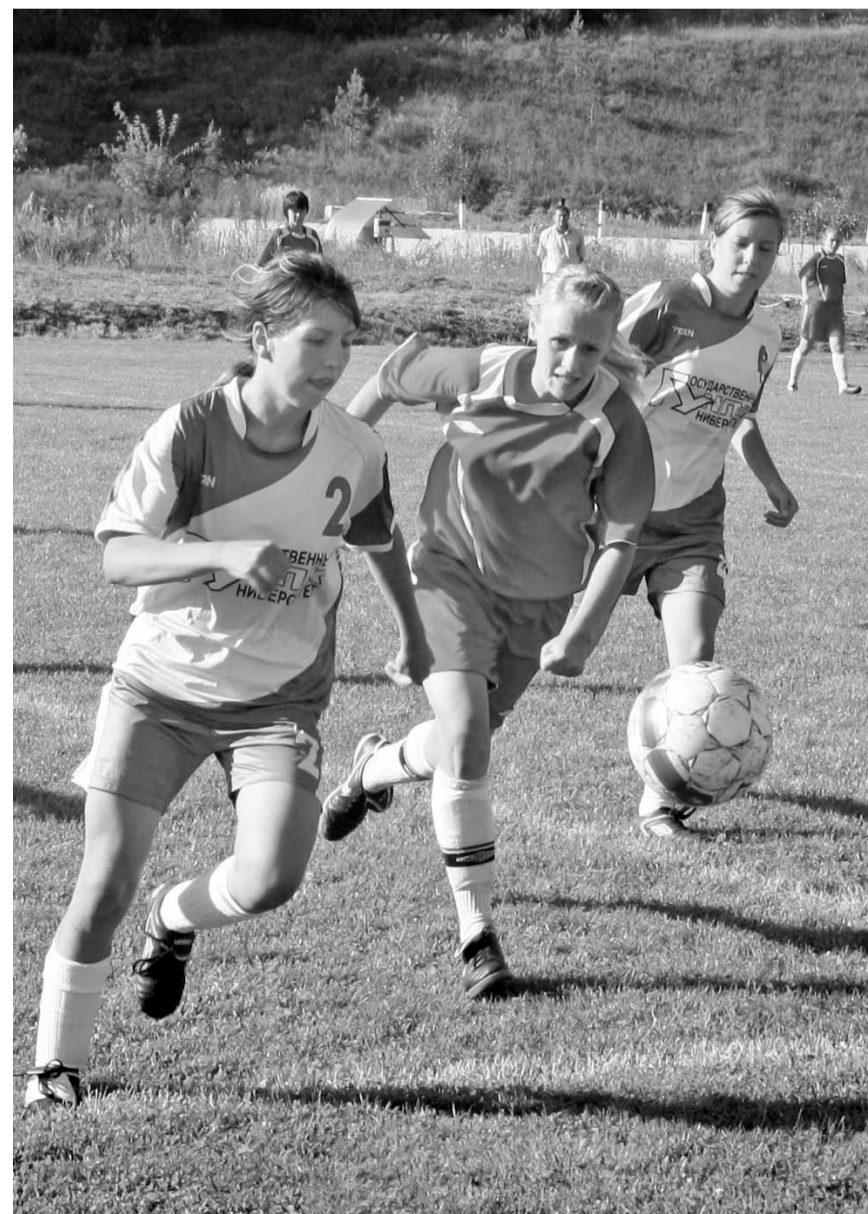
Наших девочек не просто удержать

Следующий матч первенства орловские девочки сыграют дома 18 сентября против «Олимпа» из Старого Оскола. Игра пройдет на футбольном поле базы отдыха «Зеленый берег». Начало в 17.00.