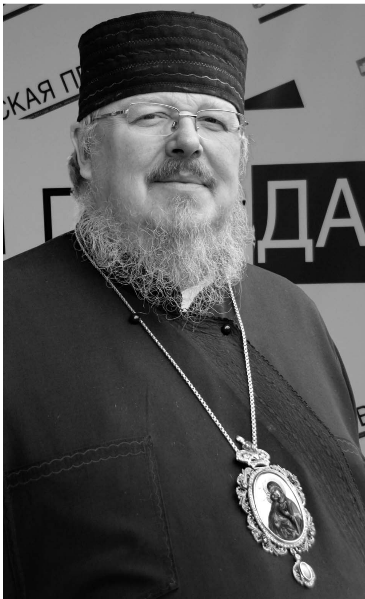
Панагия — небольшая икона Божией Матери — знак архиерейского достоинства