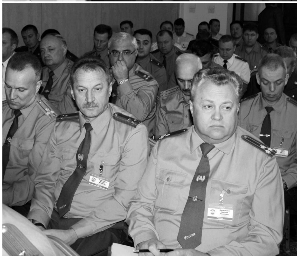
В Орле разработали тактику и стратегию развития ДПС на ближайшие годы

ОФИЦИАЛЬНО ГУБЕРНАТОР ОРЛОВСКОЙ ОБЛАСТИ УКАЗ