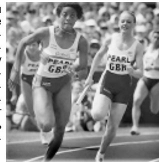
По сообщениям информгентств.

Если женщины будут продолжать с таким же успехом сокращать разницу в скорости бега, то у них появится реальный шанс стать быстрее мужчин. Об этом заявили ученые Оксфордского университета. Они проанализировали результаты забегов на Олимпийских играх с 1900 года и пришли к выводу, что к 2156 году женщины смогут пробегать 100-метровку за 8,079 секунды, в то время как мужчины — за 8,098 секунды. Однако не все согласны с этим. Бывший британский спринтер Дерек Редмонд считает, что женщины никогда не смогут догнать мужчин, потому что мужчины со временем также будут улачивать свои результаты.