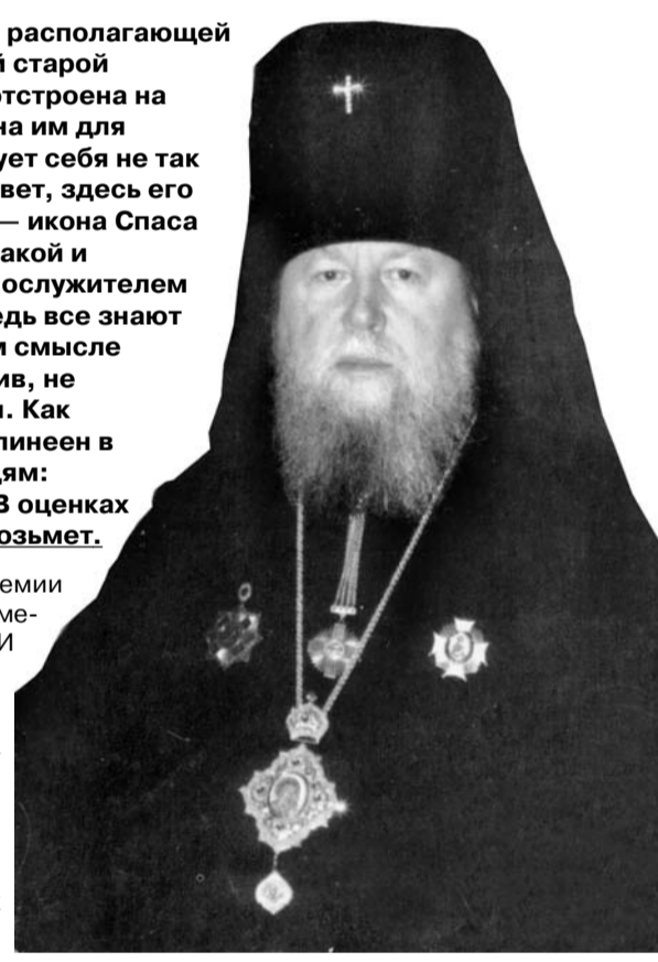
Священноначальник края принял нас в простой, располагающей к душевной домашней беседе обстановке своей старой резиденции.

Священноначальник края принял нас в простой, располагающей к душевной домашней беседе обстановке своей старой резиденции. Новая — пышная, та, что недавно отстроена на территории мужского монастыря, предназначена им для торжественных приемов.