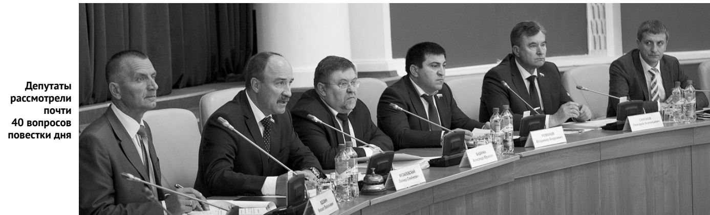
Депутаты рассматривают повестки дня