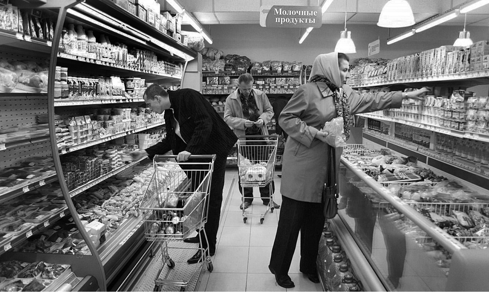
Купить и не прогадать