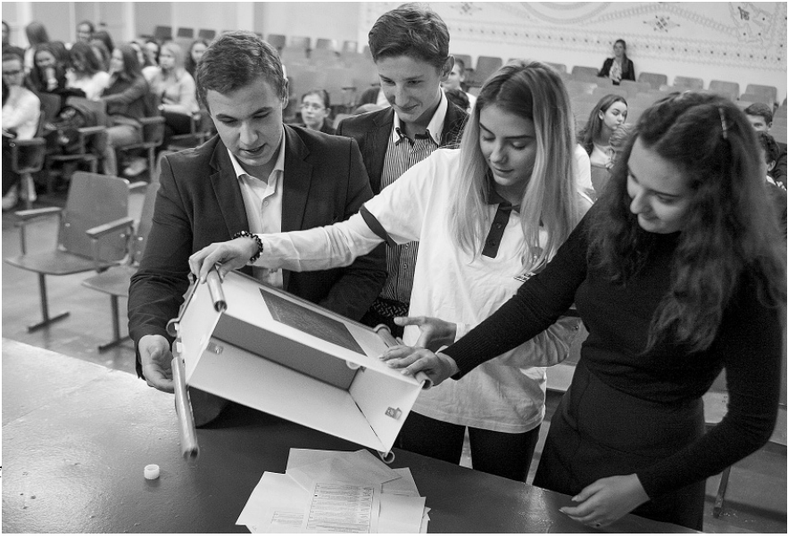
На выборах «попорошку» — всё по-настоящему