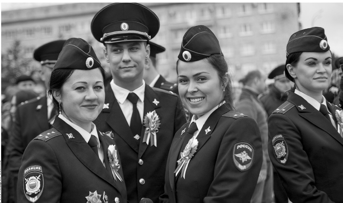
Их служба и опасна, и трудна