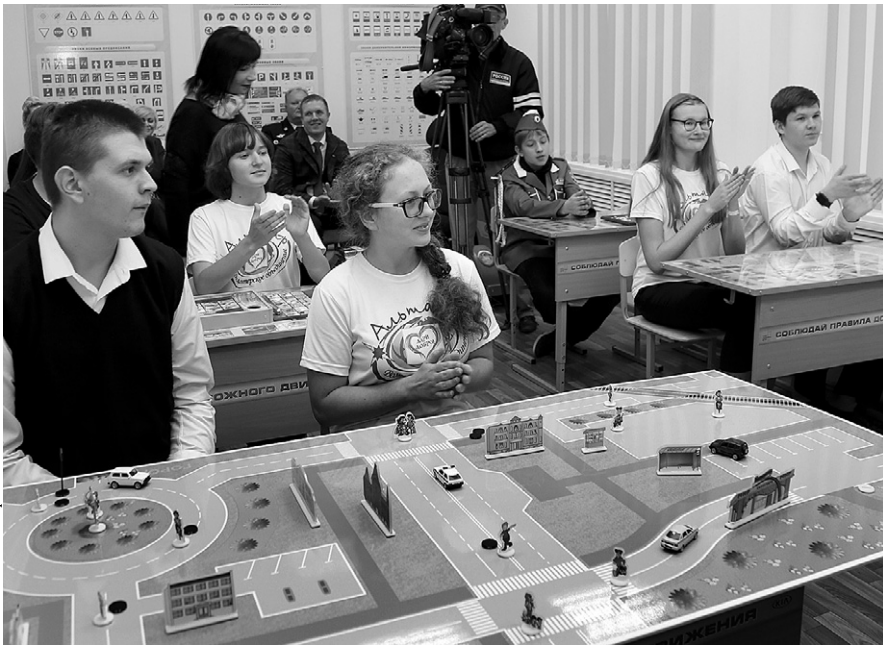
Дороги без опасности