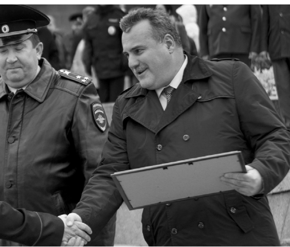
Лучшим полицейским вручили награды