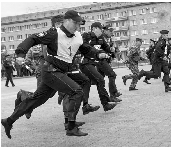
Полицейские показали свои профессиональные умения