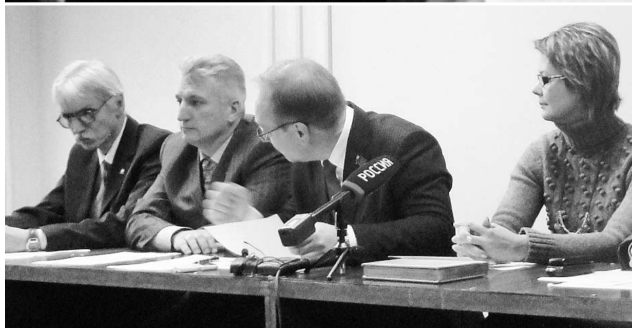
Искать нарушения — вот девиз партийцев