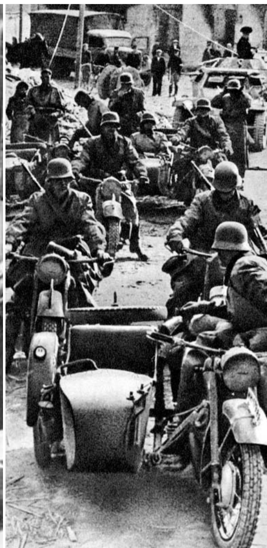
Оккупировав Орёл, немцы сосредоточились в районе вокзала. В первой половине дня 4 октября они двинулись на Мценск

званием печаталось: «Газета для населения освобожденных местностей». Первая полоса посвящалась исключительно официальной «информации» — речи фюрера, «победные» сводки с фронтов. На второй и третьей шли антисоветские материалы с карикатурами на Сталина. Их содержание сводилось к главной «мысли»: большевики пугали, что немцы будут зверствовать, а они, оказывается, хорошие. Для легкости восприятия тексты печатались в виде рассказов простых