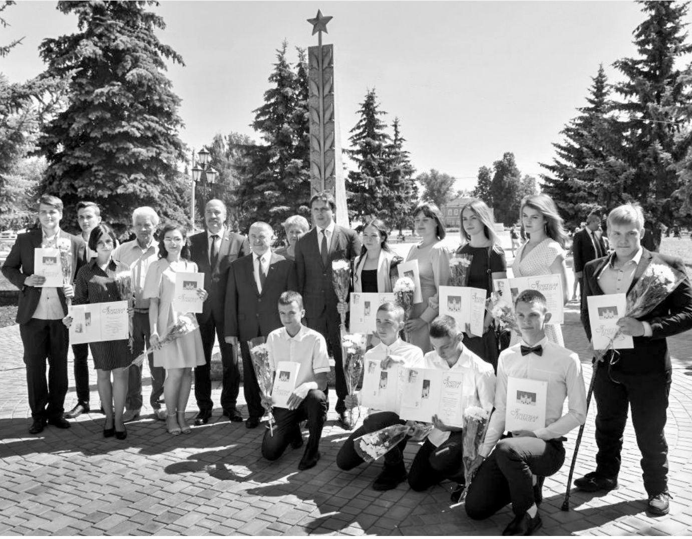
Почётный знак «Населённый пункт воинской доблести» — для кромчан священное место

Бой за Кромы с 3 августа вели 148-я (командир — генерал-майор А. Мищенко) и 74-я (генерал-майор А. Казарян) стрелковые дивизии. Когда главные силы 148-й дивизии подошли к реке Крома, сапёры под сильным огнём сделали мост, но немцы уничтожили его и создали сплош-