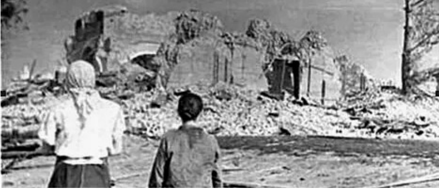
После себя фашисты оставляли разрушенные деревни и сёла