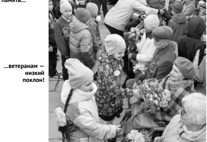
...ветеранам — низкий поклон!

Губернатор напомнил, что во время инаугурации Президент РФ Владимир Путин отметил решимость россиян отстаивать целостность и независимость страны, выразил уверенность в том, что мы достойно пройдем этот непростой исторический период, став ещё сильнее.