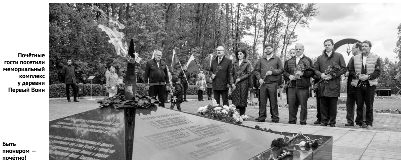
Почётные гости посетили мемориальный комплекс у деревни Первый Воин

В Мырмино Геннадий Зюганов возложил цветы к памятному знаку Героя Советского Союза Петра Татаркина.