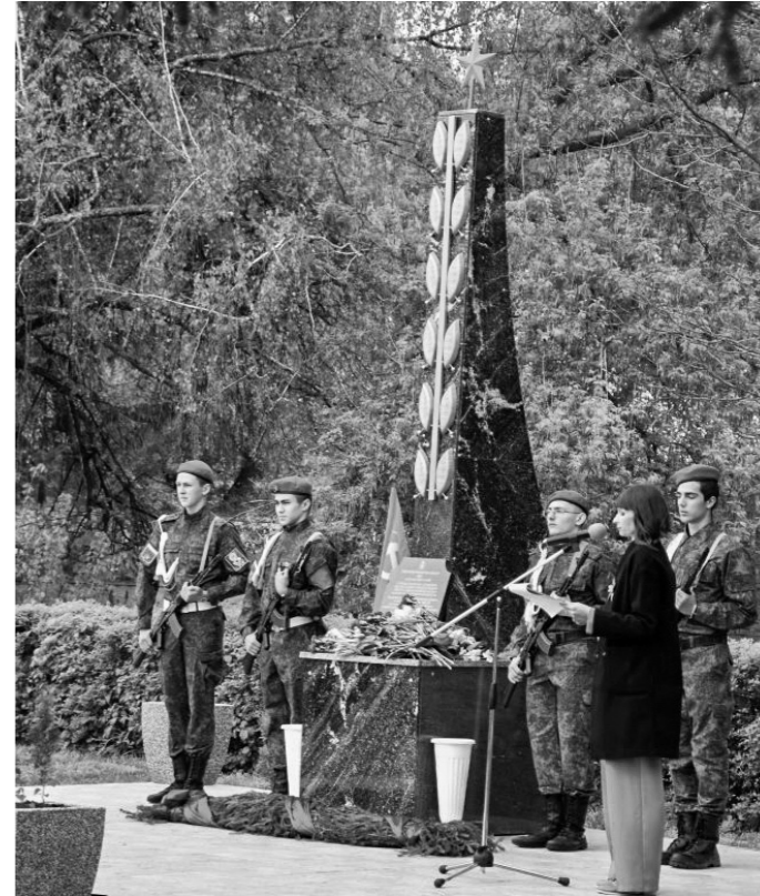
Потомки не забыли мужество, стойкость и героизм защитников деревни Первый Воин в борьбе с гитлеровскими захватчиками