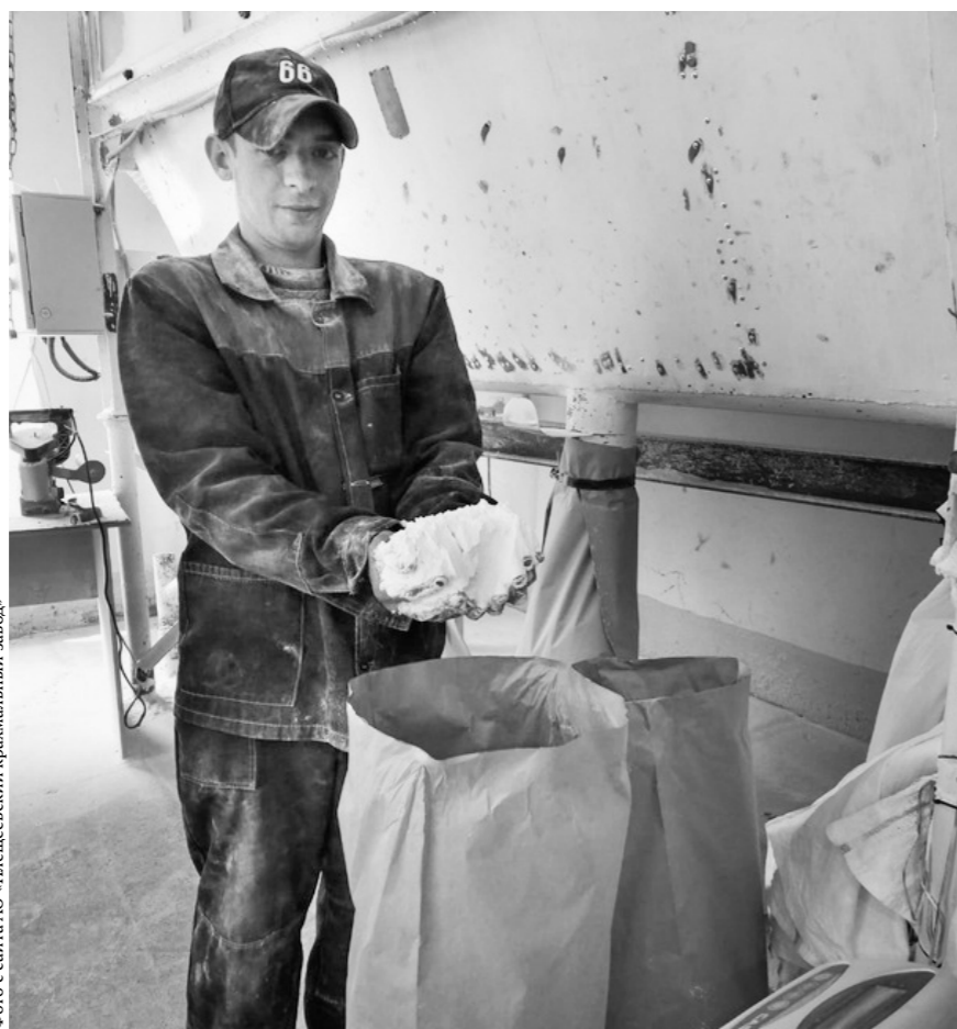
Оборудование на предприятии не самое современное, но продукция получается высокого качества