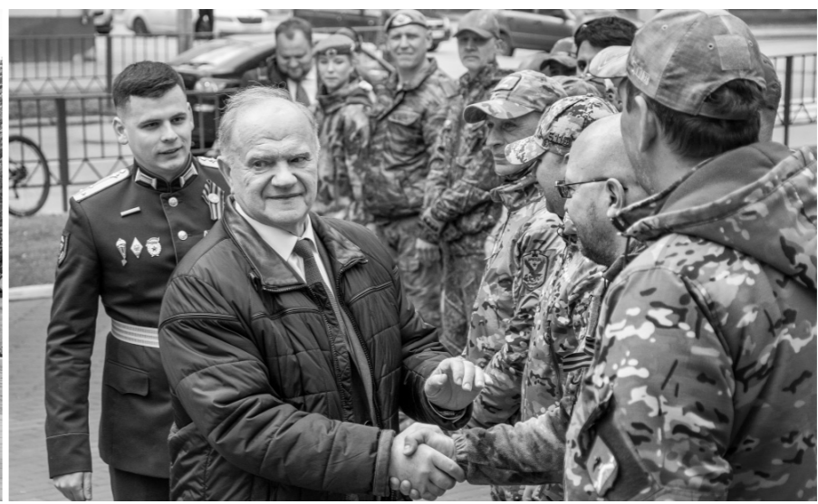
Геннадий Зюганов приветствует участников СВО

ского областного отделения КПРФ. Губернатор поздравил