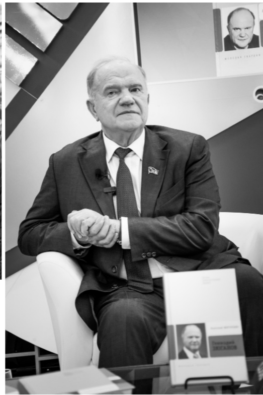
Презентация книги «Геннадий Зюганов»

торжественная церемония приёма ребят в пионерскую организацию «Орлята». Красные галстуки ребятам повязали Председатель ЦК КПРФ, почётный гражданин города Орла Геннадий Зюганов и губернатор Орловской области Андрей Клычков. Участниками церемонии также стали сенатор РФ Василий Иконников, члены