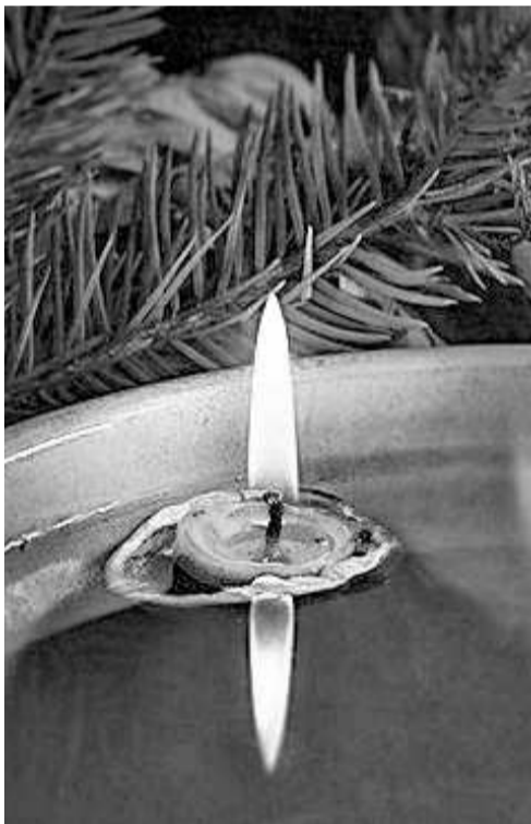
Рождественские гадания не обходятся без гадания на воске

жилому — 83 года. Всем собравшимся они показывали, как проводили рождественские святки наши предки, что ставили на праздничный стол, какие устраивали гадания при свечах.