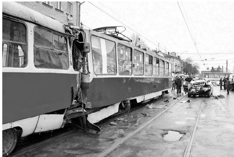
Остановить неуправляемый трамвай смог только... другой трамвай