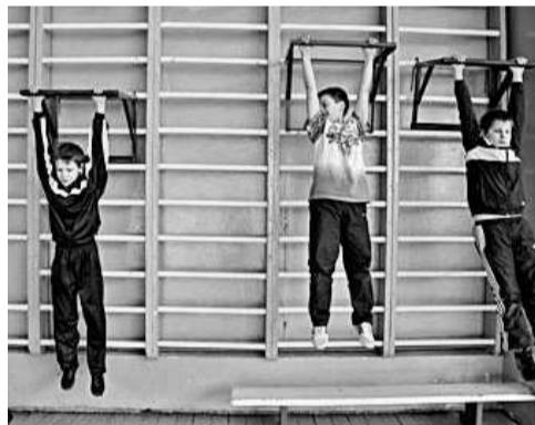
Мальчишки ревниво следят: кто больше подтянется?

— Да, заниматься спортом будут школьники не только из Орла, но и из области.