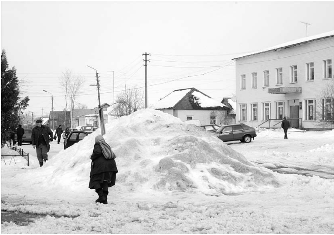
Центральная улица города Дмитровска.

Так же ситуация обстоит с расчисткой дорог и в сельских населенных пунктах Дмитровского района. Как пример, толь-