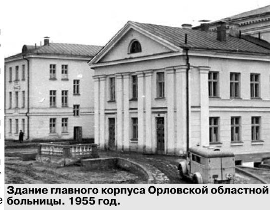
Здание главного корпуса Орловской областной больницы. 1955 год.