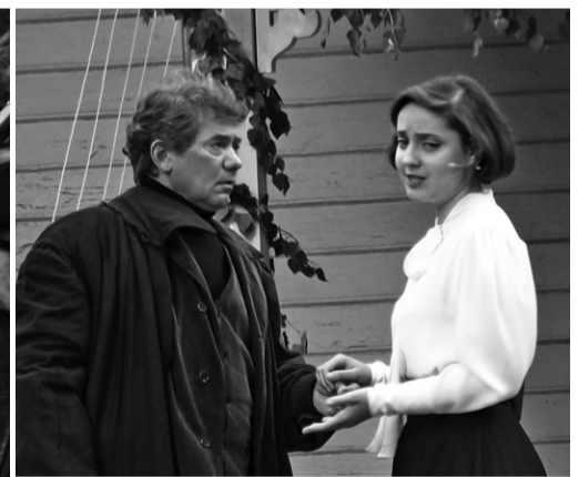
Сцена из комедии «Нахлебник»

Людмила и Виктория заметно волнуются. Проверяют сироп на нитку, на каплю.