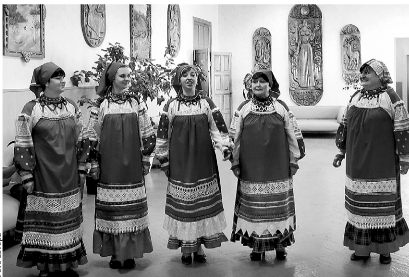
Болховский ансамбль «Любавушка»

У нас, увы, вообще частенько хорошо начатое дело не доводится до завершения. Так, уже более двух лет не введён в эксплуатацию капитально отремонтированный Знаменский районный Дом культуры —