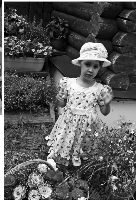
В оранжерее Спасского