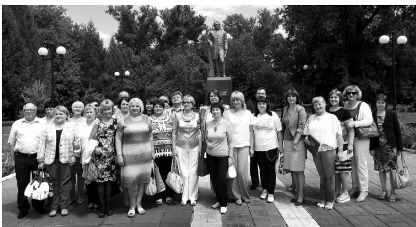
Участники пленума у памятника Ивану Тургеневу в Мценске