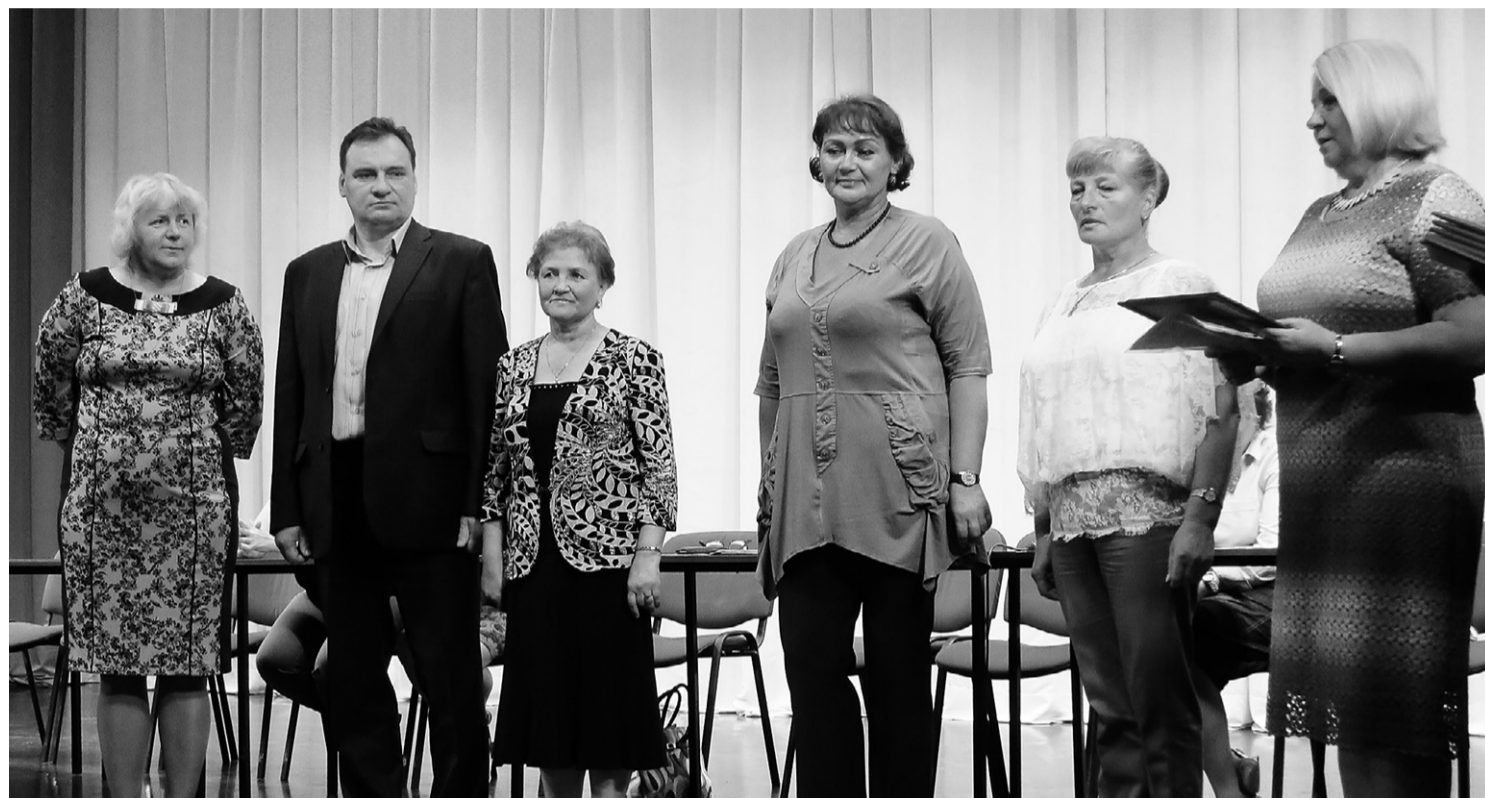
Момент награждения грамотами обкома профсоюза работников культуры области

— По уровню заработной платы работникам культуры наш регион занимает в ЦФО последнее место, — сказала она. — На сегодня средняя зарплата у работников культуры по России составляет 22466 рублей, а в нашей области — около 14 тысяч. И хотя в некоторых районах базовые ставки были установлены выше, чем в других, в целом «дорожная карта» по увеличению зарплаты работникам этой отрасли не выполнена. Для увеличения зарплат творческих работников во всех сельских учреждениях культуры начали убирать из штатных расписаний обслуживающий персонал, технических работников. В результате большинство работников отрасли выполняют дополнительную нагрузку без оплаты. Мы все надеялись на какие-то перемены к лучшему в Год культуры, но, к сожалению, надежды