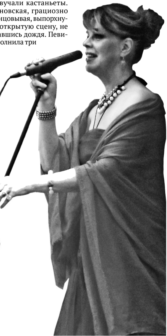
Танго Пьяццоллы в исполнении ансамбля «Легенда»

Под шум дождя зазвучали первые аккорды великой музыки, серую пелену ливня всколыхнул голос великой певицы. Опасения, что сложная оперная музыка может остаться непонятой простыми слушателями, вмиг развеялись. Казарновская «взяла» публику с первой ноты.