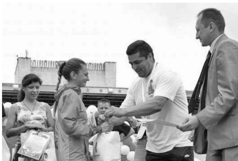
Лучшие олимпийцы получили медали и подарки