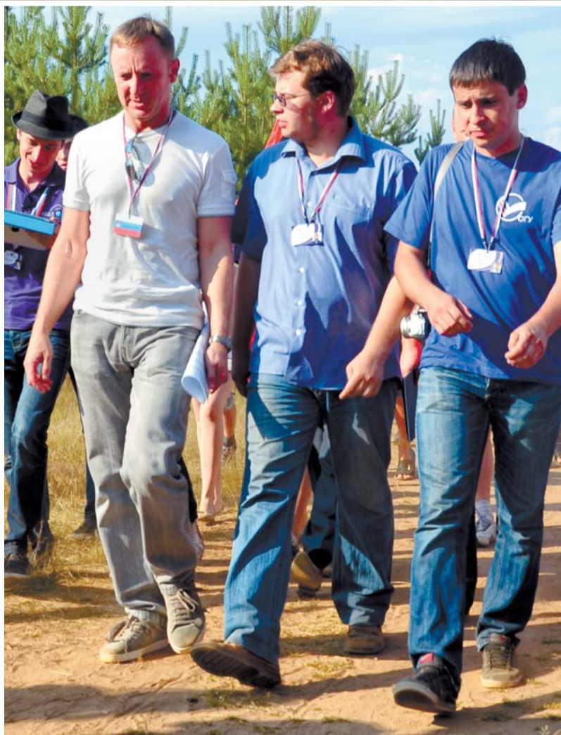
Встреча молодых ученых ОГУ с министром образования и науки Российской Федерации Д.В. Ливановым. Всероссийский молодежный образовательный форум «Селигер-2012»

правлениям и специальностям в области высшего и послевузовского профессионального образования, повышения квалификации, переподготовки кадров. Ведущим направле-