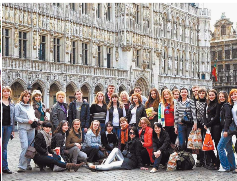
Студенты вуза на стажировке в Бельгии

В системе подготовки кадров особое место занимает воспитательная деятельность, целью которой явля-