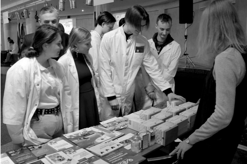
Лучшие друзья студентов — книги