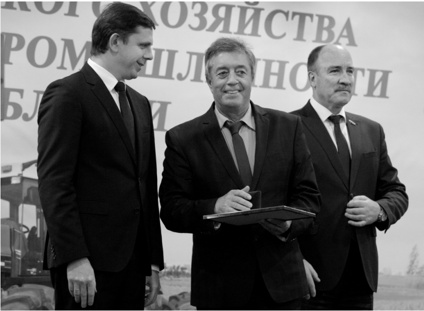
ЗАО «Славянское» — пример эффективного и социально ответственного бизнеса

рое является племенным заводом по разведению крупного рогатого скота голштинской породы, участвовало в разделе «Животноводство и племенное дело», где были представлены селекционные достижения отечественного животноводства. В экспозиции, развернутой в специализированном павильоне, было представлено многообразие основных видов и пород сельскохозяйственных животных, выращиваемых в сельскохозяйственных организациях страны — более 120 голов. Лучшие племенные хозяйства представили КРС молочных и мясных пород, лошадей верховых, рысистых и тяжеловозных пород, овец и коз, пушных зверей, рыб и птиц. Орловское предприятие отмечено за достижение высоких показателей в развитии племенного животноводства. В ЗАО «Славянское» содержится 790 коров, за 2021 от каждой бурёнки надоено 10 892 кг молока — лучший результат в Орловской области! На «Золотой осени» хозяйство представило двух коров-первотёлок: Данию (№ 2904) — максимальный суточный надой 46 кг молока с содержанием жира 3,94 %, белка — 3,35 % и Незнакомку (№ 2455) — максимальный суточный надой 47 кг молока с содержанием жира 3,92 %, белка — 3,34 %. Представленные коровы-экспоненты также отличались правильным экстерьером, опрятным внешним видом. Участниц на конкурс отбирали из 40 самых лучших «славянок» претенденток. И как показали результат, кон-