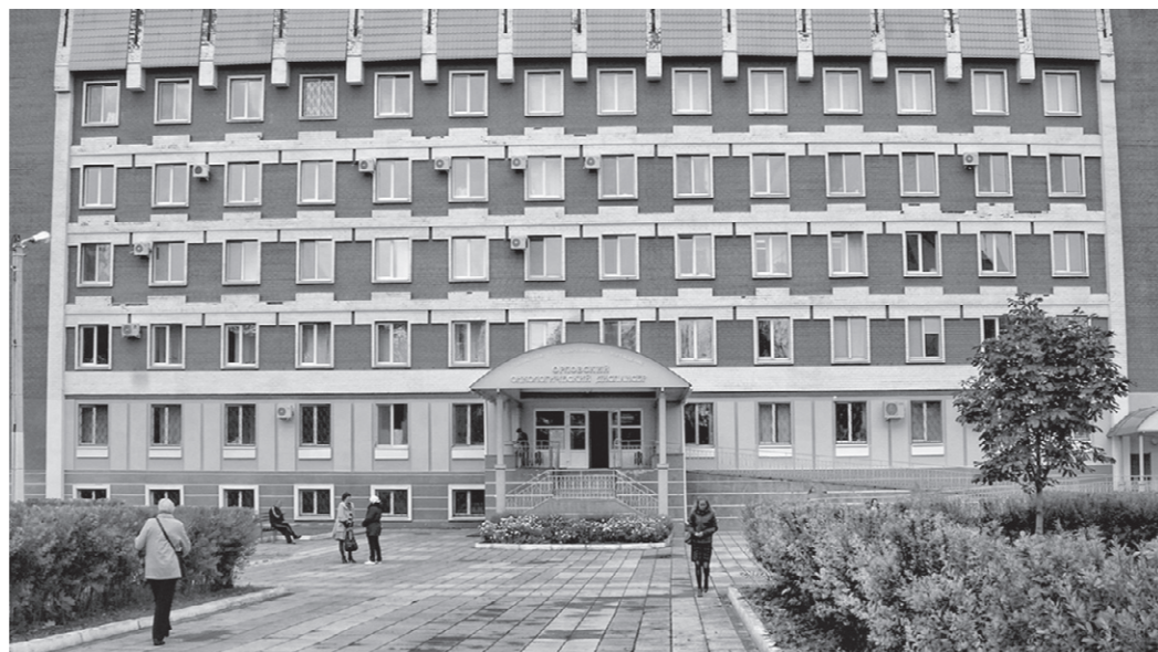
В онкодиспансере, когда появится пристройка, вместо 220 будет 320 койкомест

550 млн. рублей израсходовано из федерального и областного бюджетов на закупку оборудования для онкодиспансера