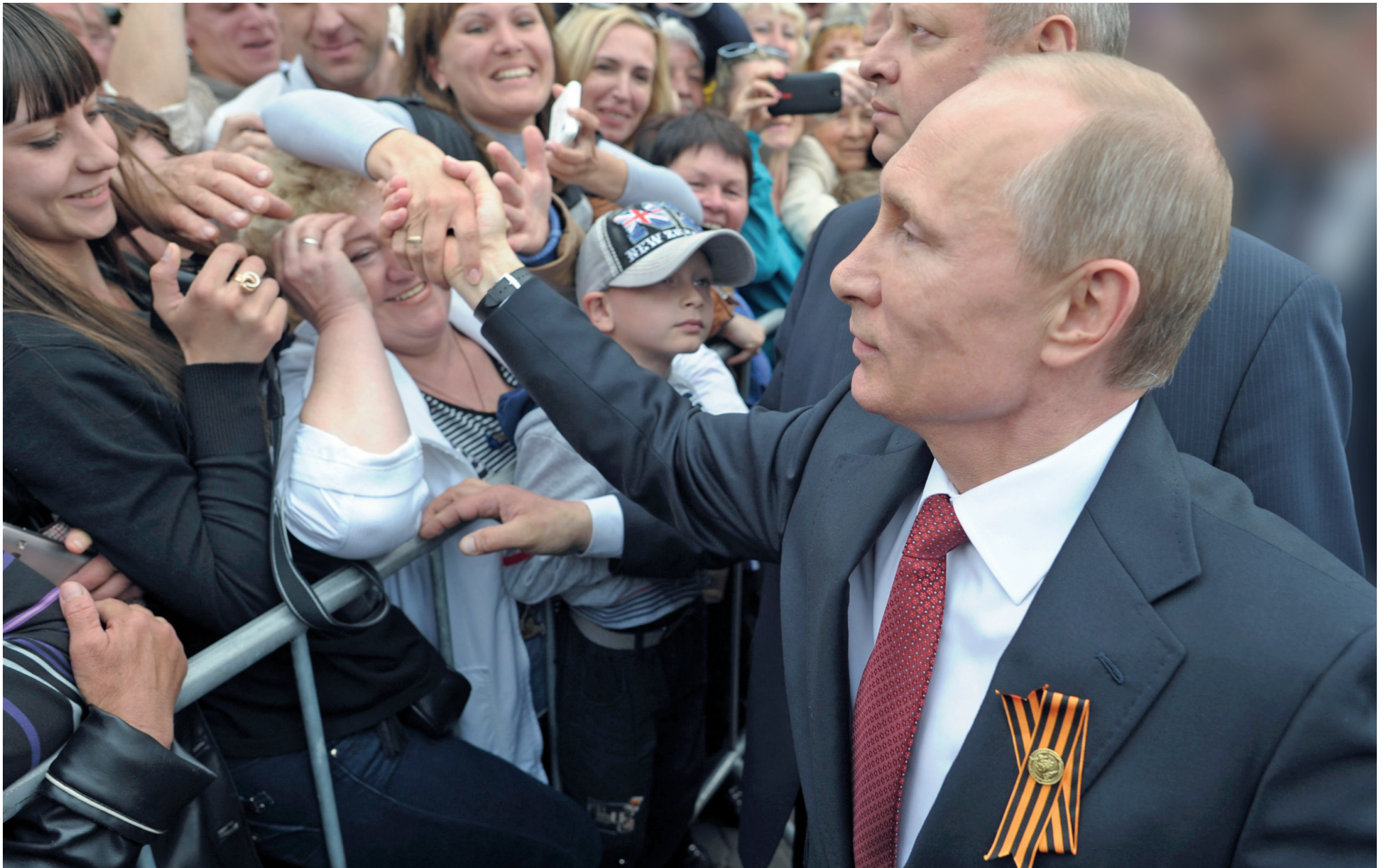
Встреча Владимира Путина с крымчанами в мае 2014 года