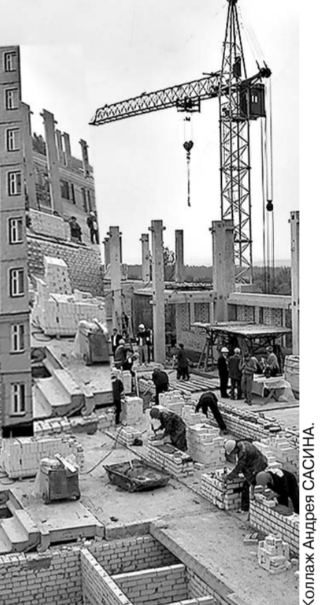
Коллаж Андрея САШИНА

да надо будет дополнительно выпустить более 2 тыс. "Газелей", которые просто не пройдут по нашим улицам. Поэтому это предприятие делает все для того, чтобы сохранить муниципальный транспорт, думает о перспективах. Перспективы, по словам А.Я. Коровина, связаны прежде всего с пуском окружной трамвайной линии в густонаселенный и развивающийся 909-й квартал, в район аэропорта, с выходом на существующую линию. Это обеспечит жителей квартала транспортом большой вместимости. Можно увеличивать вместимость вагонов, прицепляя к первому вагончику второй и даже третий, при этом не загрязняя улицы. Есть программа пустить трамвай из Железнодорожного района в Советский с выходом на микрорайон. Рассматривается вариант продолжения троллейбусной линии по Наугорскому шоссе, где ведется широкое строительство жилья, до Никуличей. Намечается наладить троллейбусное движение из района госуниверситета по улицам Гагарина, Розы Люксембург с выходом к желез-