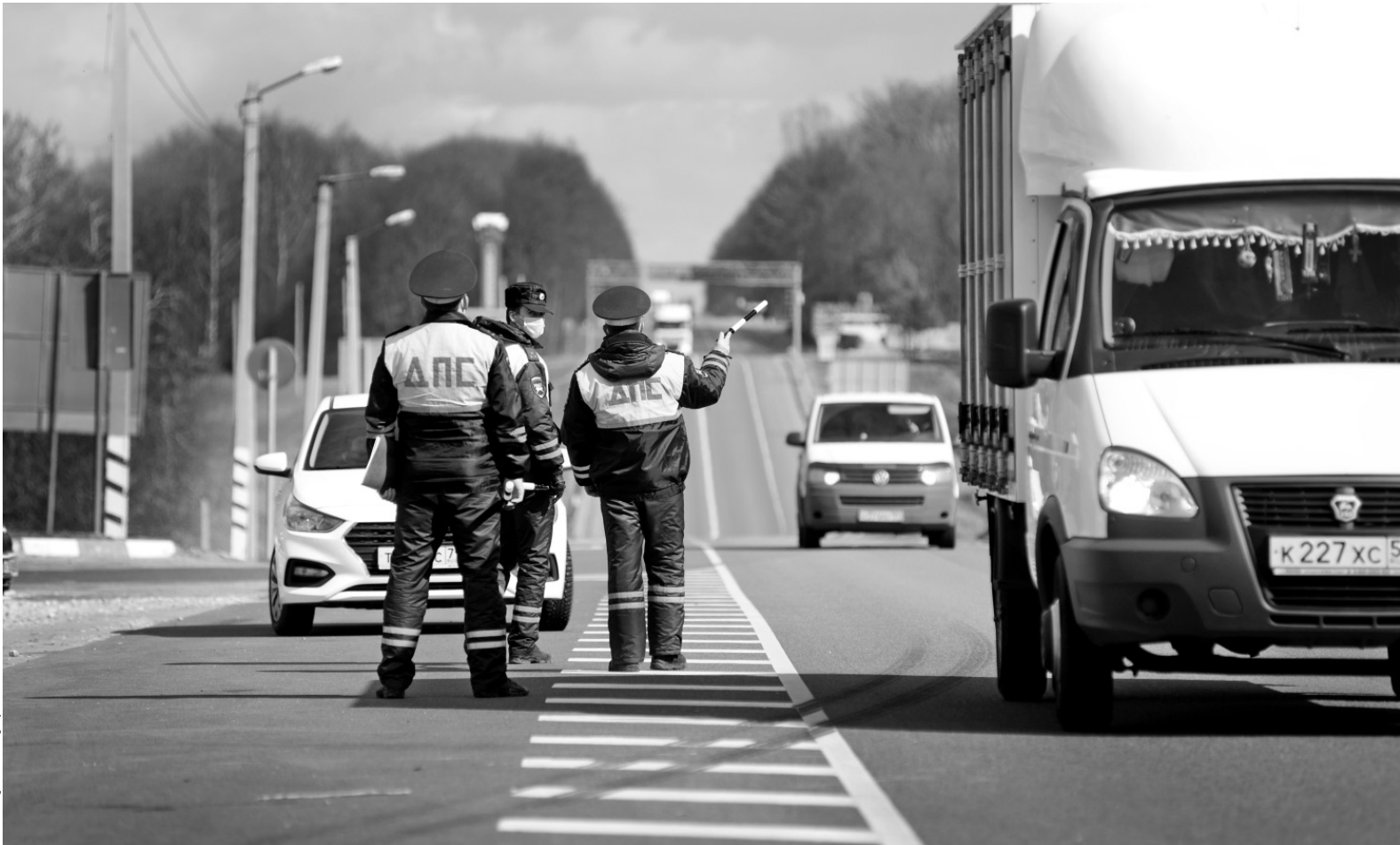
Особое внимание — приезжающим в наш регион