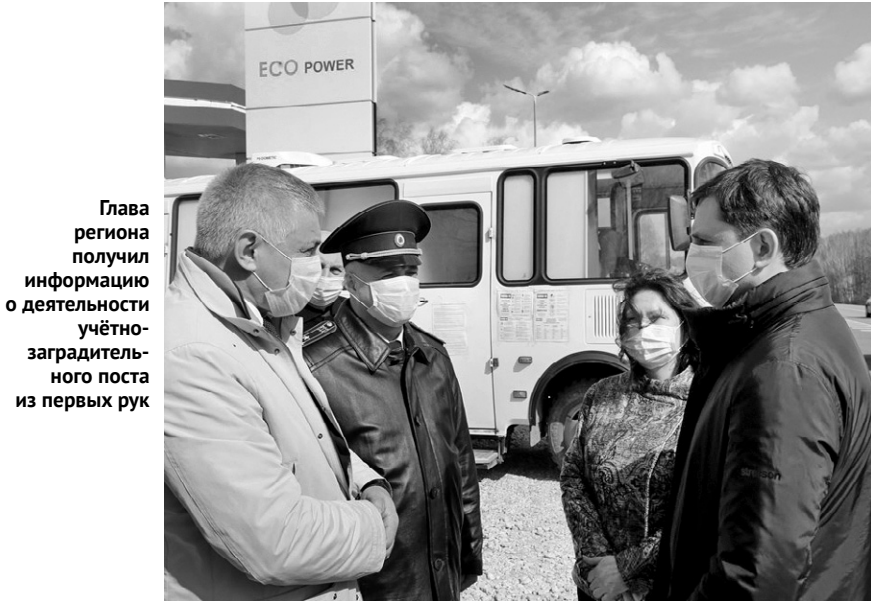
Глава региона получил информацию о деятельности учётно-заградительного поста из первых рук