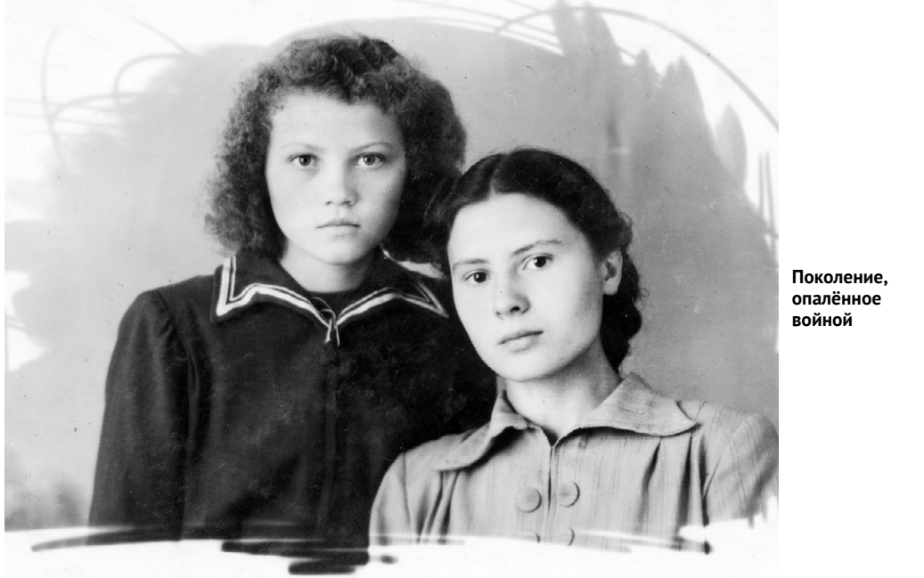
Поколение, опалённое войной

Решения своей судьбы люди ждали в нечеловеческих условиях.