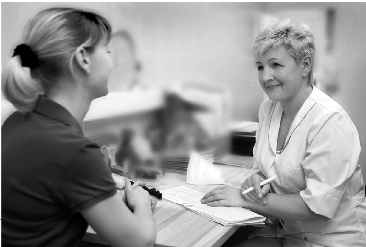
Расскази доктору о своих проблемах

Сейчас ситуация изменилась в лучшую сторону. На отсроченном обслуживании