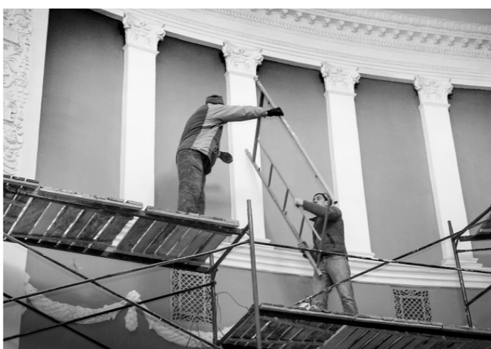
В зале театра «Свободное пространство» уже снимают леса