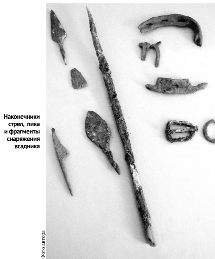
Наконечники стрел, пики и фрагменты снаряжения всадника

Новые исторические памятники расположены в верховьях реки Орлик и носят названия Сорokino 1 и Сорokino 2. Они были открыты в 2012 году липецким учёным Максимом Ивашовым при обследовании участка реконструкции магистрального нефтепровода «Куйбышев — Унеча — Мозырь-1» в Хотынецком районе. Именно эти