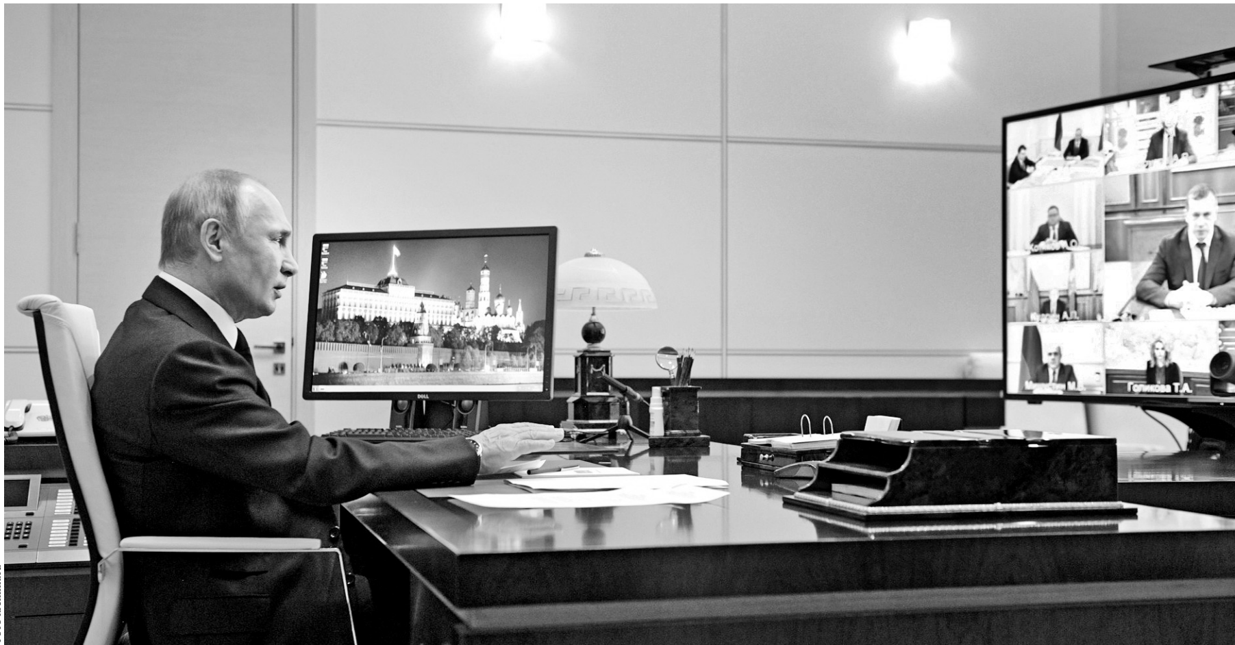
Владимир Путин: — Обращение за помощью должно быть простым и удобным для бизнеса с возможностью дистанционной подачи заявки без очередей и спешки

15 апреля Президент России Владимир Путин в режиме видеоконференции провёл совещание с членами правительства, посвящённое вопросам поддержки экономики, бизнеса, занятости и доходов граждан в условиях борьбы с эпидемией коронавируса