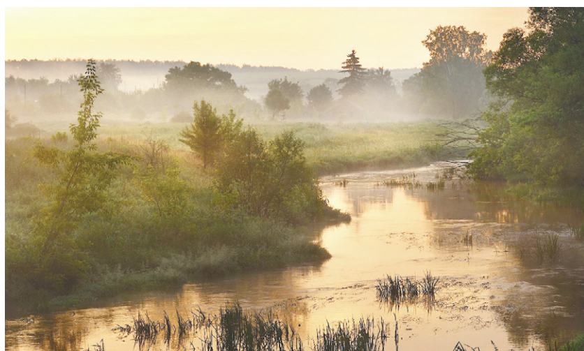
Алексей Бородин. Оптуха на рассвете

«Орловские фотохудожники очень талантливо, в ярких красках рассказывают о красоте и многообразии дикой природы нашего края.»