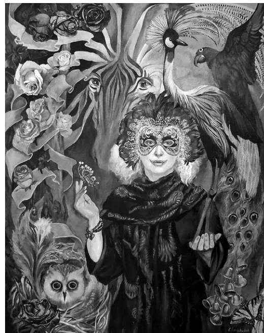
«Улыбайтесь, улыбайтесь, господа»