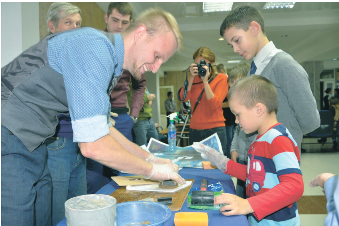
Фестиваль науки проходит в опорном университете ежегодно

вышение профессионального мастерства. Это означает, что помимо основной профессии студент имеет возможность получить рабочую специальность, расширить круг своих знаний и умений. Ведь какой из тебя получится инженер, если ты никогда не стоял за станком? Или технолог пищевого производства, если ты не умеешь на практике замесить тесто?