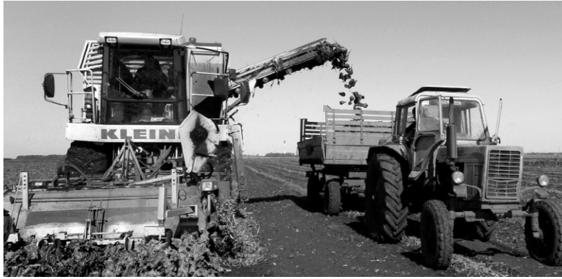
А на свекольном поле работа кипит вовсю

По информации руководителя регионального департамента сельского хозяйства Юрия Сидыганова, на утро 26 сентября всего по области обмолочено 830 тыс. га зерновых культур (97 % плана), в том числе 475 тыс. га озимых зерновых культур (100 % плана) и 355 тыс. га яровых зерновых и зернобобовых культур (94 % плана). На сегодня общий намолот зерна составляет 2 млн. 727 тыс. тонн при средней урожайности зерновых 32,8 ц/га. По намолоту зерна лидируют семь районов: Ливенский, Покровский, Колпнянский, Орловский, Свердловский, Мценский, Верховский. Гречиха убрана на 82 %