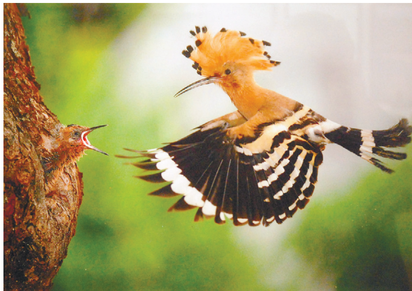
Наталья Гераськина. Удод — заботливый отец

«Рыбаки» — семейная пара зимородков отдыхает на ветке после удачной рыбалки. Как признался мне сам автор, в успехе дела важную половину занимает приличная фототехника, остальное — знание повадок, ну и конечно, любовь к пернатым.