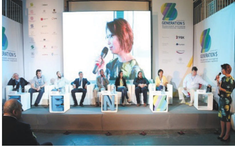
Сотрудничество с российской венчурной компанией ОАО «РВК» и Акселератором «GenerationS»