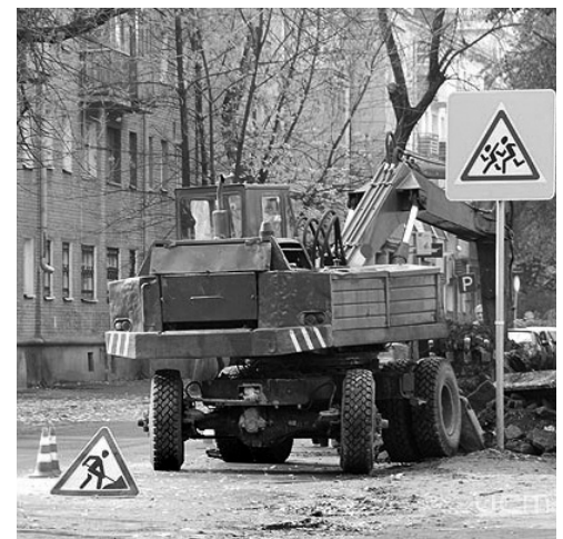
Ремонт орловских улиц продолжается

Все эти организации должны были сдать свои объекты в эксплуатацию ещё в июне, однако этого так и не произошло. Причины у каждого подрядчика, разумеется, нашлись. Кого-то подвела организация, не поставившая вовремя асфальтобетонную