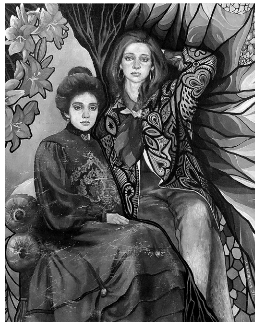
«Прабабушка» из цикла «Близнецы»