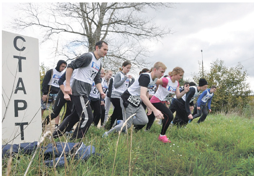
Международный день студенческого спорта