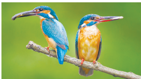
Дмитрий Голубев. Зимородки — отменные рыбаки

Как тут пройти мимо настоящему мастеру с фотоаппаратом?!