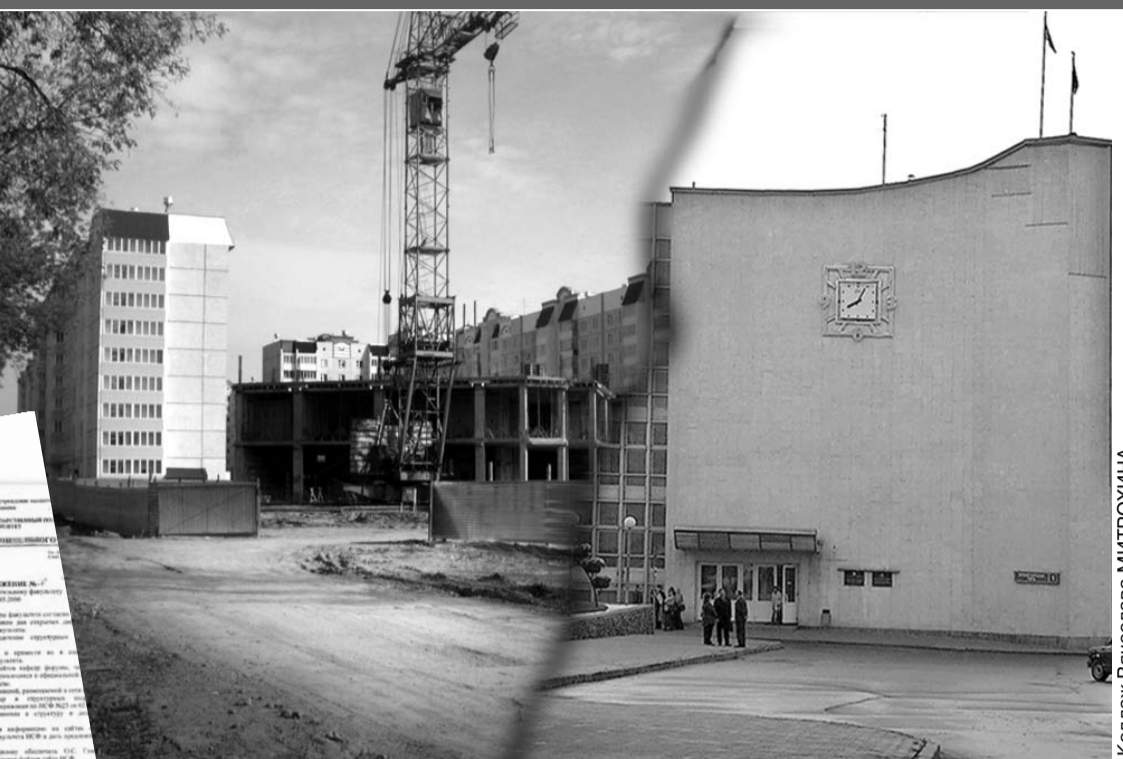
Коллаж Вячеслава МИТРОХИНА.

Есть также абсурдные примеры, когда чиновники мэрии заставляли людей ходить по замкнутому кругу: оформлять все необходимые документы на участок, зная о том, что без проведения аукциона, или без подачи объявления в газету, их решение о предоставлении участка может быть отменено прокуратурой. И такие случаи были, их десятки.