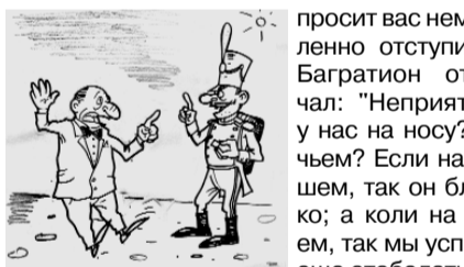
просит вас немедленно отступить". Багратион отвечал: "Неприятель у нас на носу? На чем? Если на вашем, так он близко; а коли на моем, так мы успеем еще отобедать".