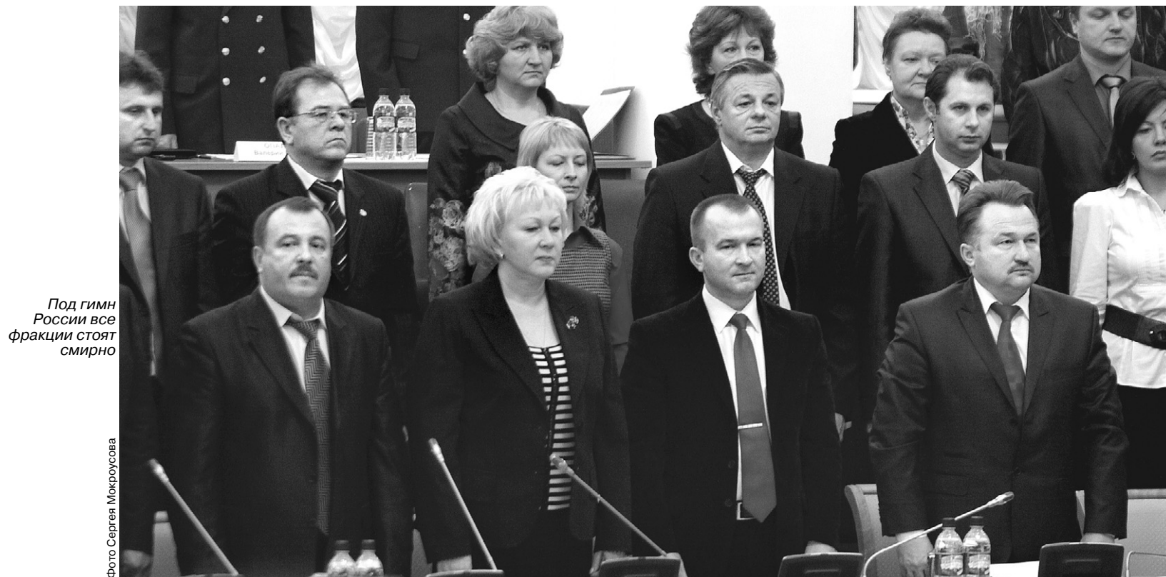
Под гимн России все фракции стоят смирно

А вот и «красна девица» — депутат Валенти-