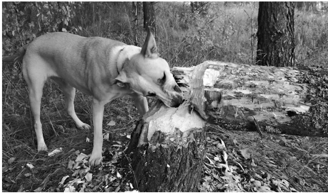
Наш адрес: 302000, г. Орел, ул. Брестская, 6, к. 31.