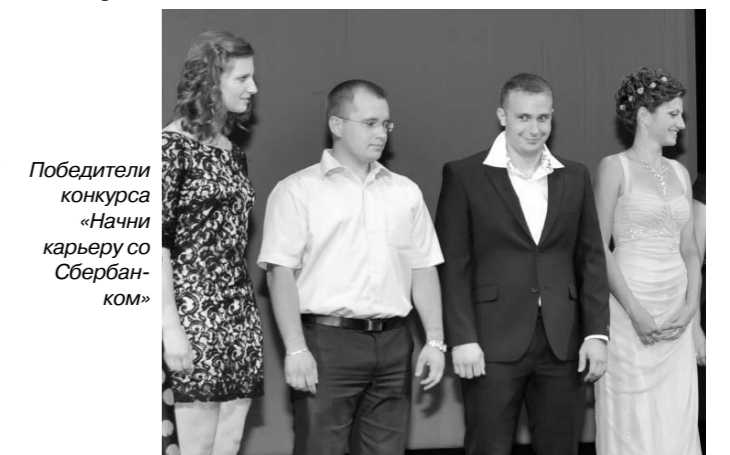
Победители конкурса «Начни карьеру со Сбербанком»

21 июня выпускники Орловской банковской школы получили дипломы.