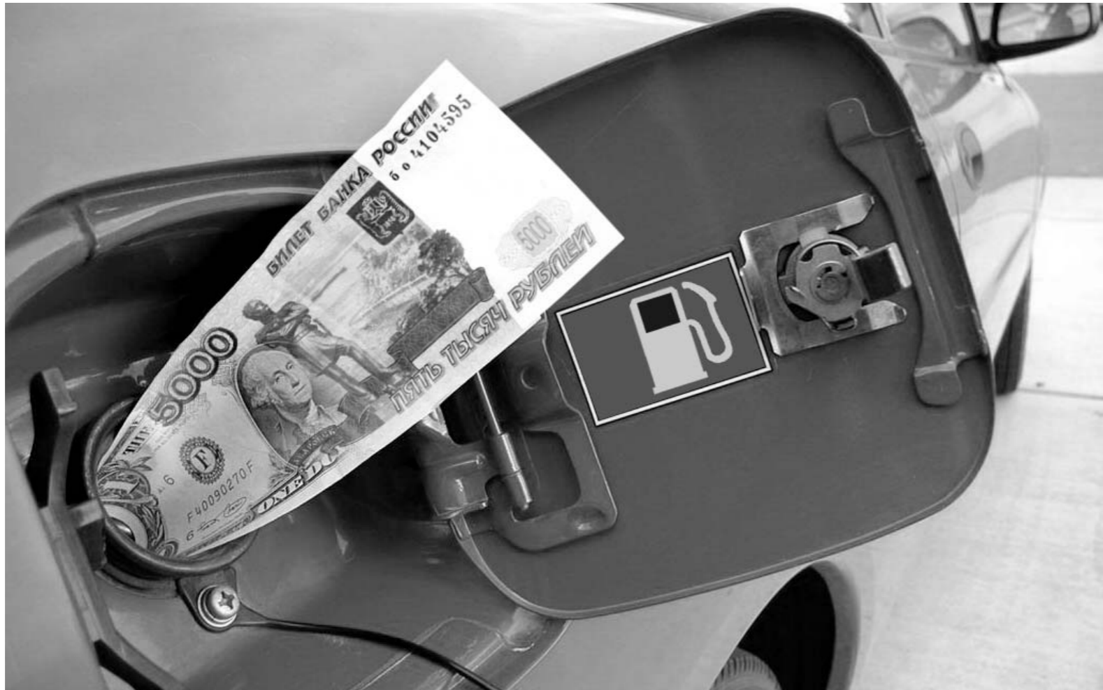
Парадокс: когда цены на нефть упали, цены на бензин полезли вверх

Поэтому курс валюты зависит от колебаний притока и оттока валюты в российскую экономику, и так как российская экономика полностью зависит от экспортных поставок сырьевых товаров на зарубежные рынки, то и курс рубля имеет пря-