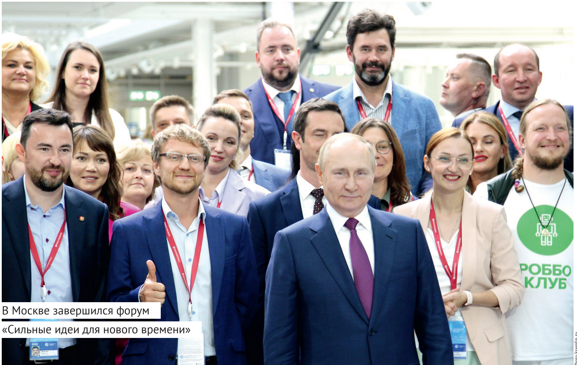
В Москве завершился форум «Сильные идеи для нового времени»