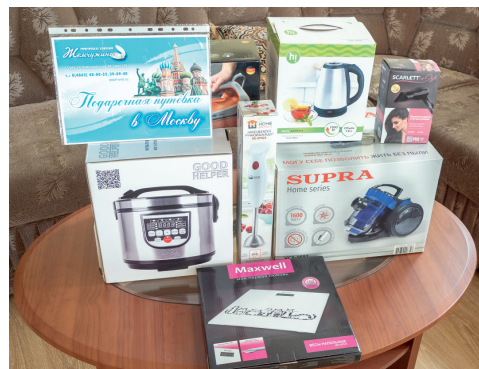
Утюг хорошо, а два — лучше!

20 июля в жилом многоквартирном доме на улице Заводской в Мценске загорелась крыша