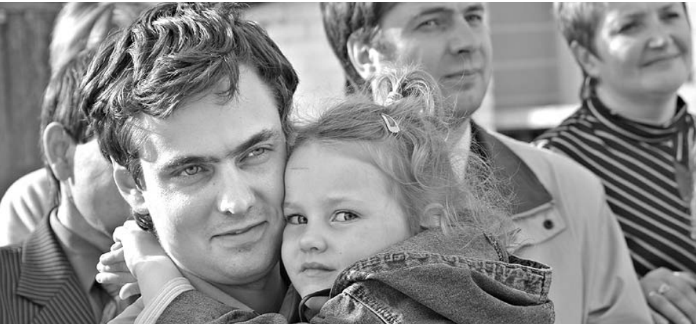
просьбу областных и городских властей помочь завершить строительство. «Социальная инициатива» начала в

Помимо ЖК «Покровский» в работах задействованы ООО «Стройтехнология», МПХ ВКХ «Орелводоканал», ООО «Энергомонтаж» —