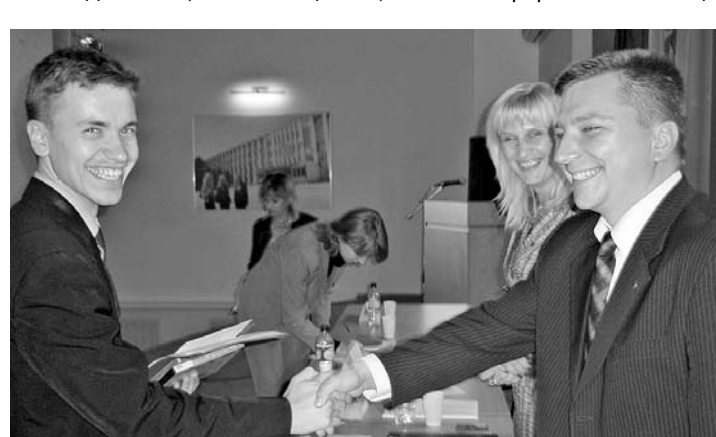
Так встречали друг друга на конференции выпускники президентской программы подготовки управленческих кадров.

зала на конференции своим коллегам, как возникла идея создания ассоциации. Она проходила обучение по этой программе в 2004—2005 годах, была вместе с другими предпринимателями на стажировке в Германии. И по возвращении домой все чаще возникала мысль, что хорошо было бы объединиться, чтобы общаться, чтобы