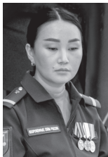
На встрече было рассказано немало удивительных, незабываемых, трогательных историй о великой материнской и сыновней любви, о вчерашних мальчишках, которые стали солдатами, защитниками и шагнули в бессмертие, выполняя данную ими клятву — не посрамить своих героических дедов и прадедов.

Были, конечно, пронзительные рассказы о любви, которая преодолевает даже саму смерть.