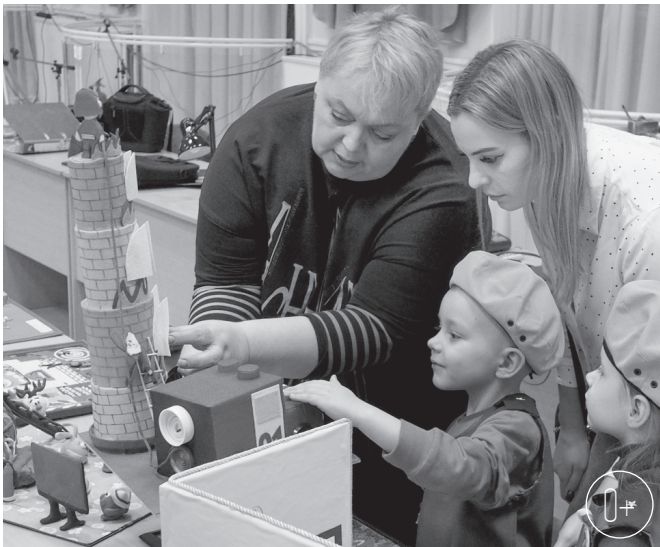
В этом году творческие работы оценивали кадеты-спасатели из детских садов № 47 и № 1 г. Орла

Перед жюри стоял нелёгкий выбор, ведь все конкурсанты представили достойные рисунки и подел-