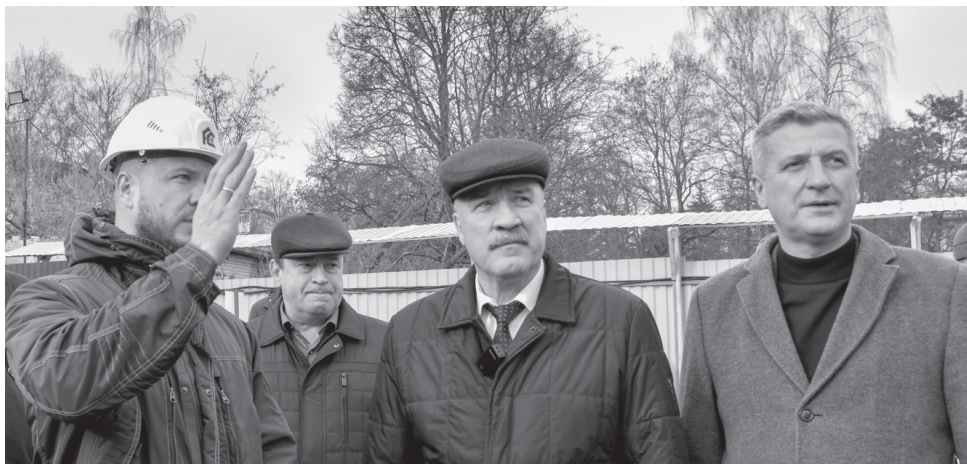
Депутаты облсовета взяли объект на особый контроль

Первоначально объект должны были сдать в ноябре 2024 года, потом сроки перенесли на апрель 2025-го. Будущий спорткомплекс превратился в долгострой из-за проблем с проектно-сметной документацией и финансовыми трудностями подрядчика. За это время стоимость объ-