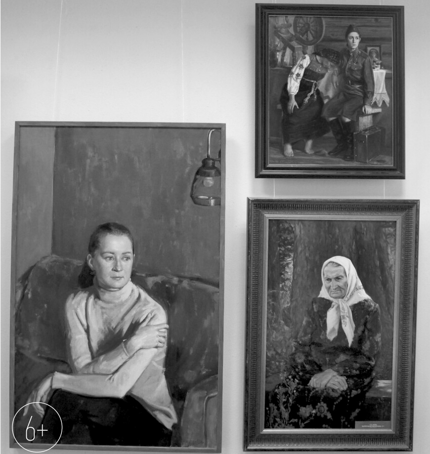
Женщина-мать, женщина-вдохновительница, женщина-героиня... Женские образы — один из самых любимых у художников