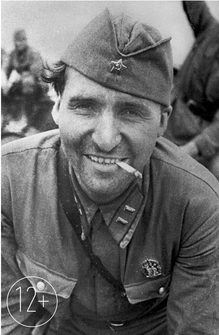
Военный корреспондент газеты «Красная звезда» Константин Симонов

Выставка под таким названием, посвящённая 105-летию со дня рождения писателя, участника Великой Отечественной войны К. М. Симонова, открыта в областной библиотеке им. И. А. Бунина.