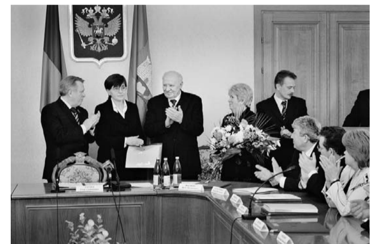
В рамках национального проекта «Образование» парк школьных автобусов Орловщины пополнили ещё семь новеньких ПАЗов. 22 февраля на заседании коллегии Орловской области губернатор Егор Семёнович Строев вручил ключи от транспортных средств руководителям сельских школ.