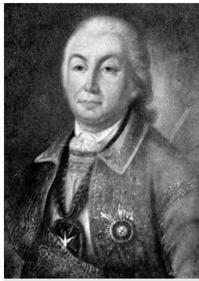
Генерал-фельдмаршал П.С. Салтыков. Шим к пышностям и великолепиям в командирах, чудно нам сие и удивительно казалось, и мы не понимали, как такому простенькому и, по все-му видимому, ничего не значащему старичку можно было быть главным командиром столь великой армии и предводительствовать ею против такого короля, который удивлял всю Европу своим мужеством, проворством и знанием военного искусства...

Когда-то у Николая Гоголя вырвалось горькое признание: "Велико незнание России посреди России". К сожалению, эти слова звучат актуально и в наши дни. Чем глубже погружаешься в историю отечества, тем чаще подстерегают такие находки, что диву даешься: почему до сих пор об этом не было известно? Почему, скажем, жителям Глазуновского района так долго было неизвестно, что на их земле находилось имя одного из лучших русских полководцев XVIII века, генерал-фельдмаршала графа Петра Семеновича Салтыкова?