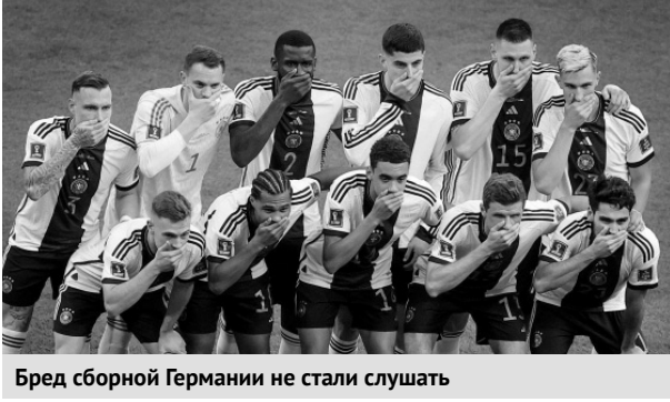
Бред сборной Германии не стали слушать

Не удалось им продать и использование «радужной» тематики на играх чемпионата мира. Немцам запретили лететь на самолёте, раскрашенном в ЛГБТ-цвета, а всем командам использовать капитанские повязки в радужных цветах.