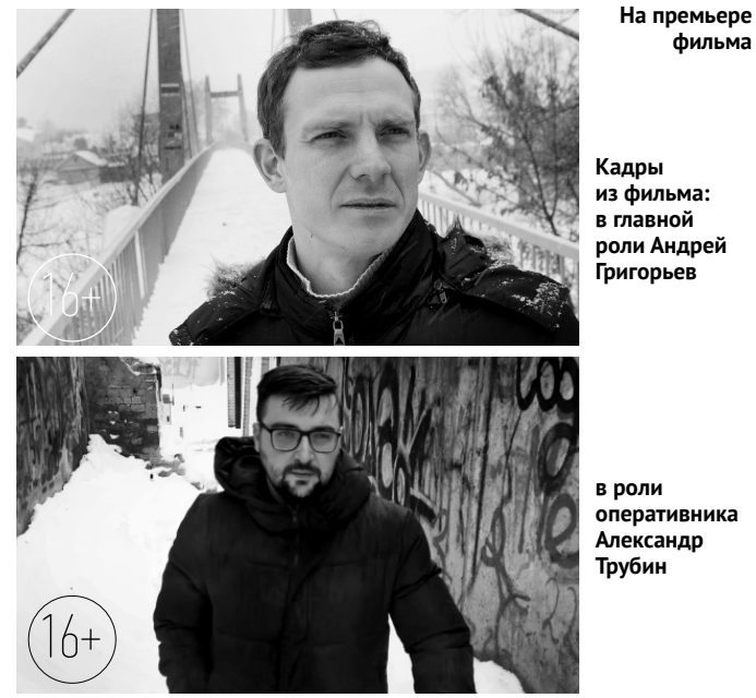
На премьеру фильма