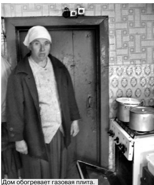
Дом обогревает газовая плита.