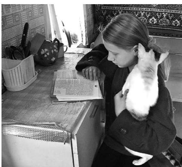
Уроки приходится делать, предварительно утеплившись.